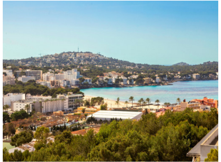
Vistas al mar