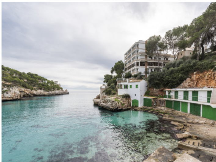
Vista al mar

Toda la información como mejor se puede saber, salvo por error durante el periodo de venta. Sirva este documento como un informe previo, las bases legales solo serán válidas a través de un contrato de compra acordado ante Notario.