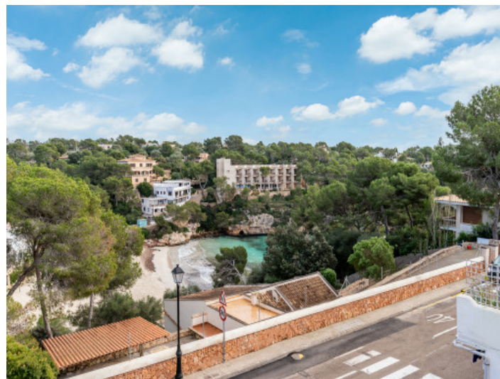
Vista a la cala