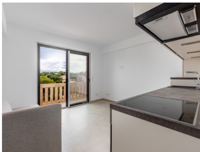
Sal3n abierto con cocina