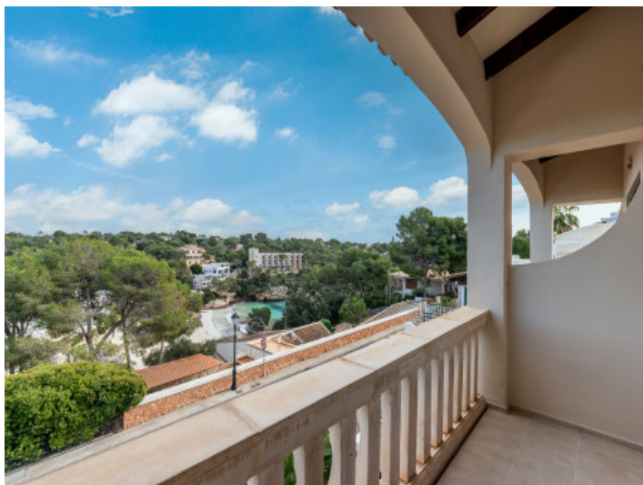
Vista desde el balcón