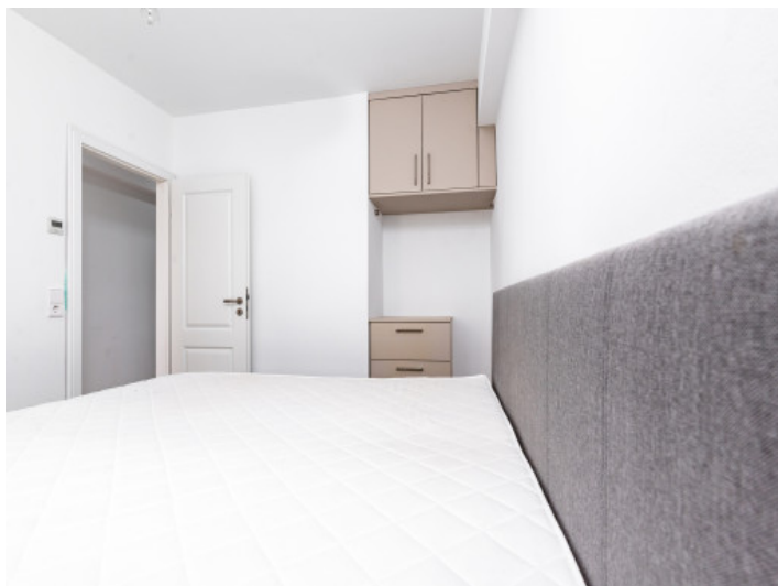
Vista alternativa al dormitorio