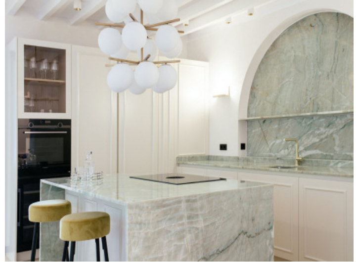
Cocina de lujo