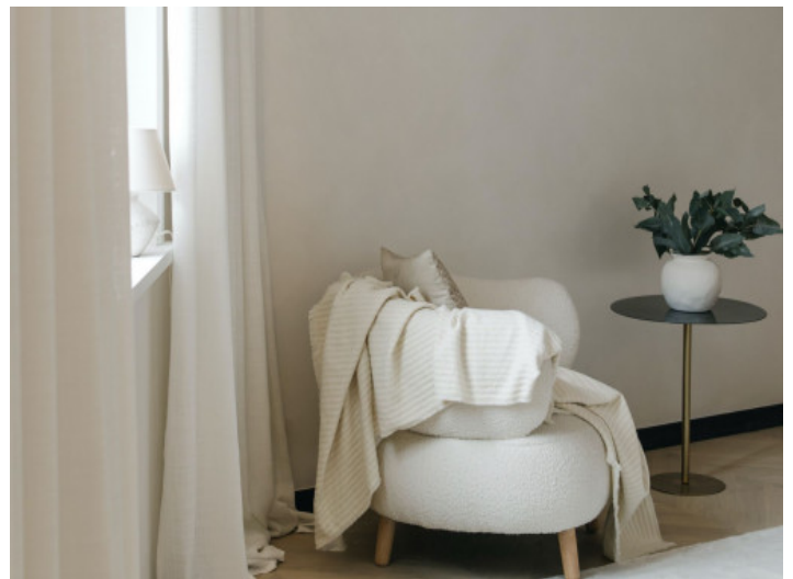
Zona de estar

Toda la información como mejor se puede saber, salvo por error durante el periodo de venta. Sirva este documento como un informe previo, las bases legales solo serán válidas a través de un contrato de compra acordado ante Notario.