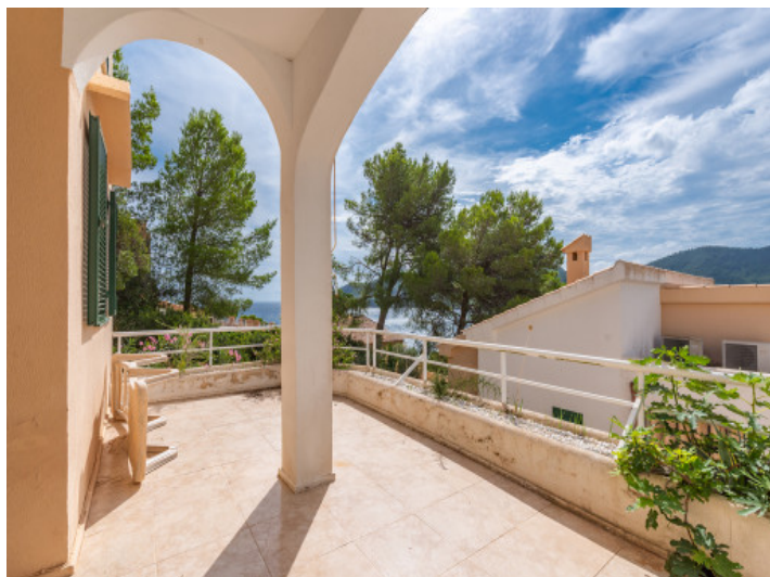
Piso con vistas al mar y terraza en Canyamel