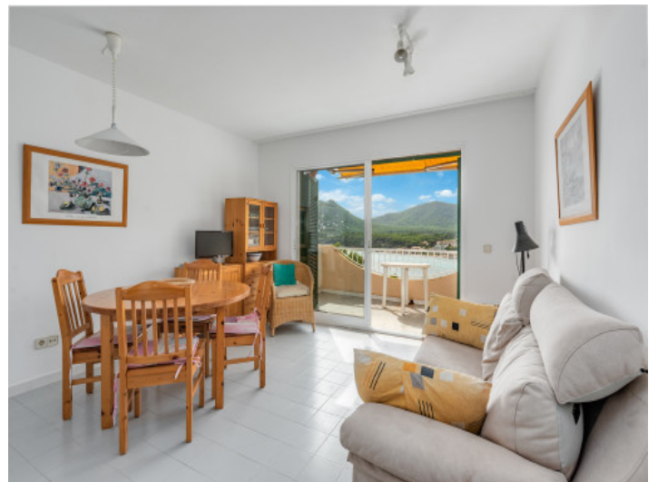
Salón y comedor