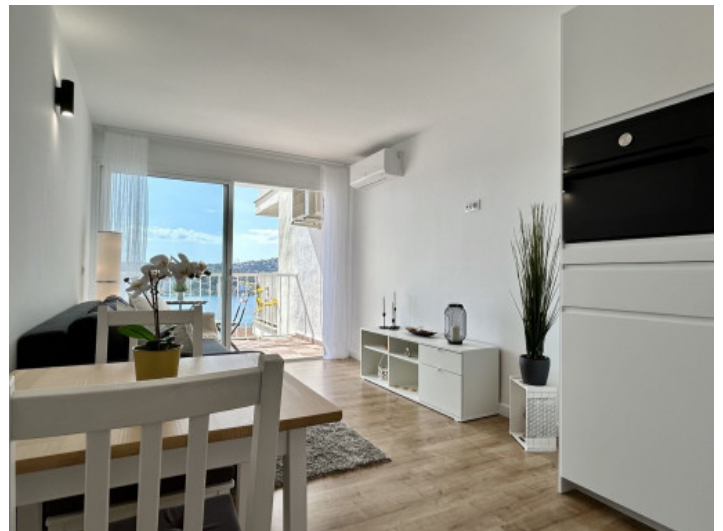
Salón - comedor