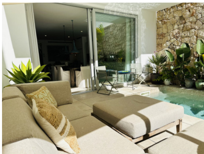
Patio y piscina