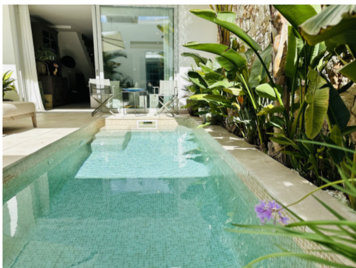
Patio y piscina