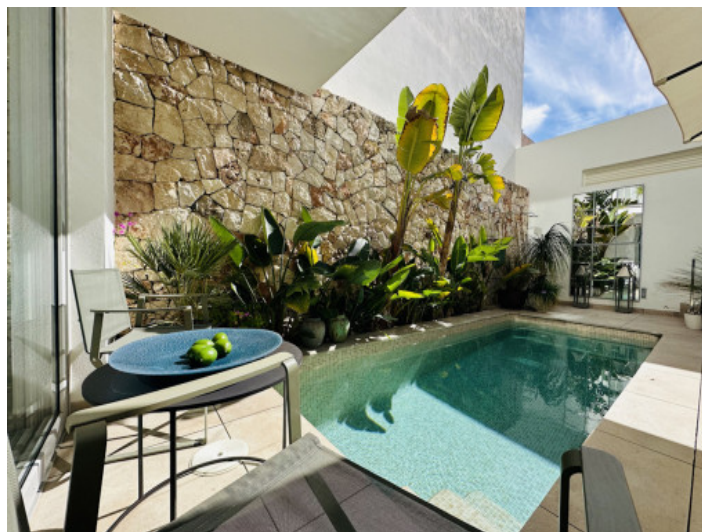
Patio y piscina