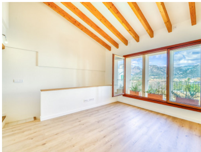
Salón Planta 2