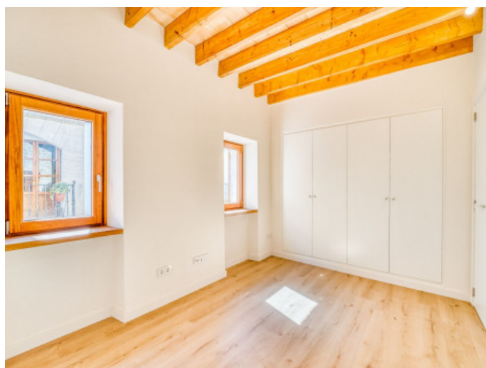
Dormitorio Planta 1

Toda la información como mejor se puede saber, salvo por error durante el periodo de venta. Sirva este documento como un informe previo, las bases legales solo serán válidas a través de un contrato de compra acordado ante Notario.