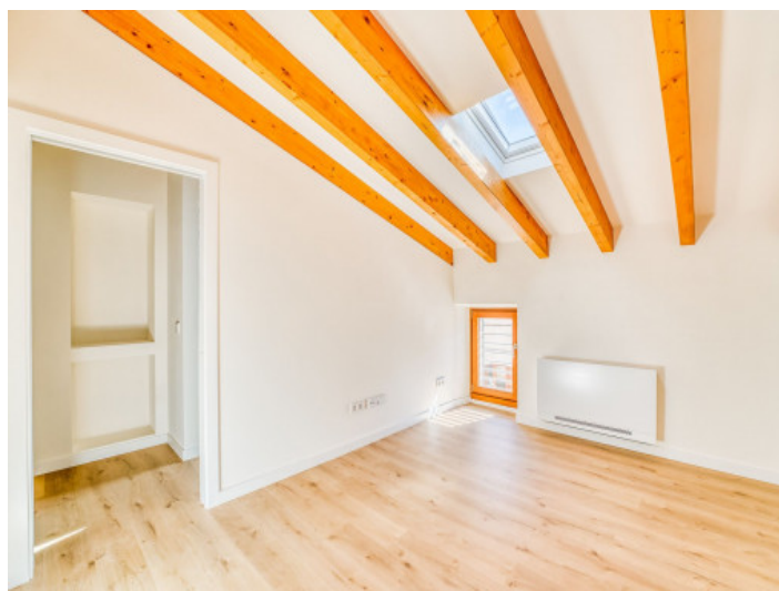
Dormitorio Planta 2