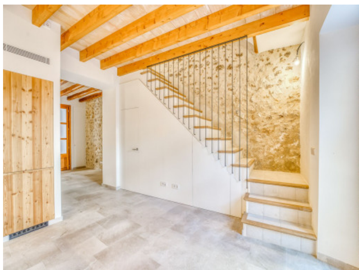
Acceso planta superior