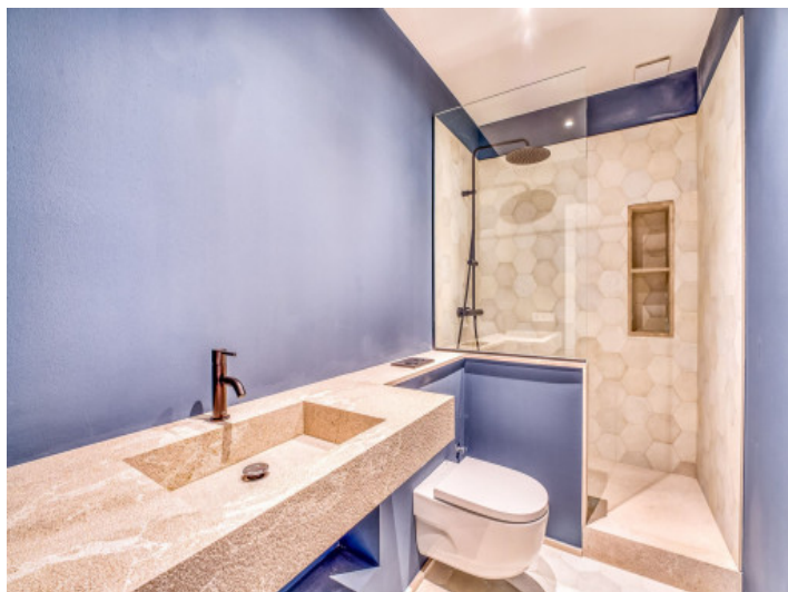
Baño Planta 1