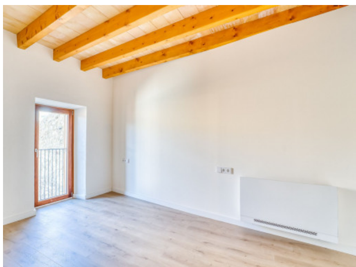
Dormitorio Planta 1