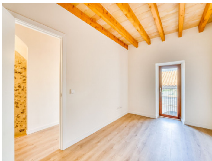
Dormitorio Planta 1