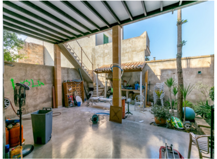
El espacio exterior ofrece amplio espacio