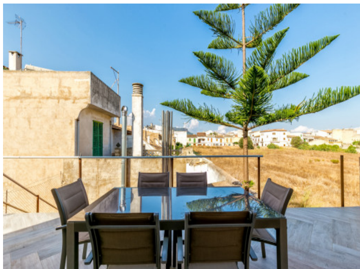
Terraza con vistas al paisaje circundante