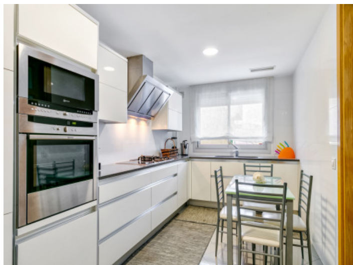
Cocina de alta calidad con comedor

Toda la información como mejor se puede saber, salvo por error durante el periodo de venta. Sirva este documento como un informe previo, las bases legales solo serán validas a traves de un contrato de compra acordado ante Notario.