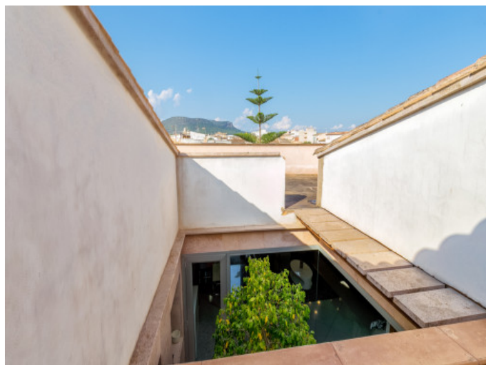
Patio moderno con azotea

Toda la información como mejor se puede saber, salvo por error durante el periodo de venta. Sirva este documento como un informe previo, las bases legales solo serán válidas a través de un contrato de compra acordado ante Notario.