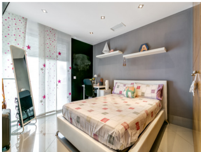
Uno de 3 dormitorios