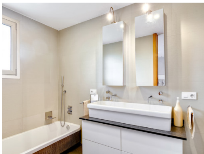
Baño elegante con bañera