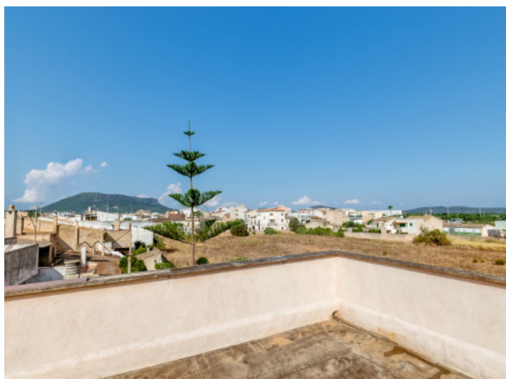
Azotea con vistas estupendas