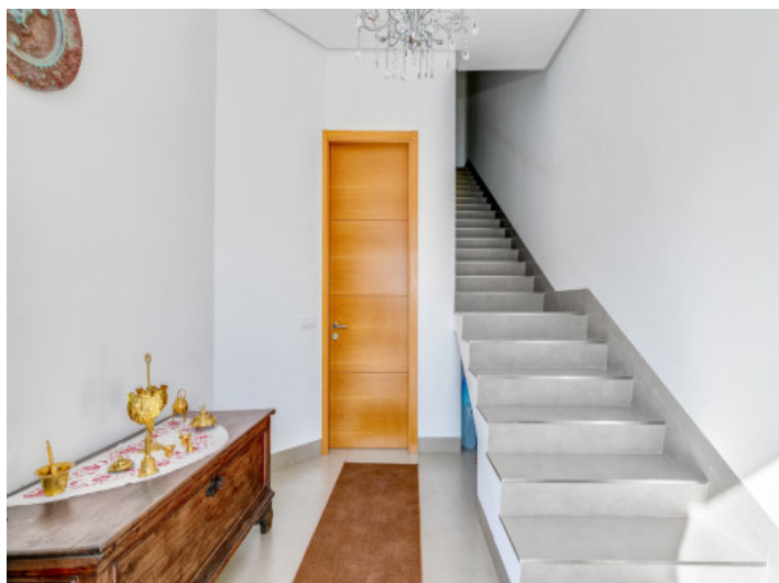
Acceso atractivo a la sala de estar