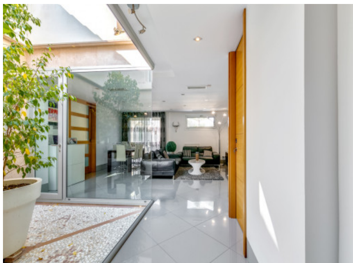
Concepto viviente moderno