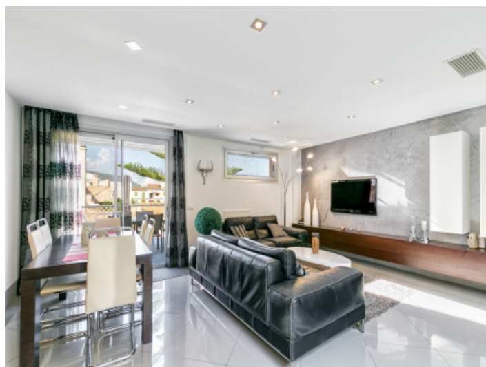
Salón-comedor moderno con terraza