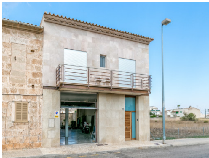
Vista exterior de la casa