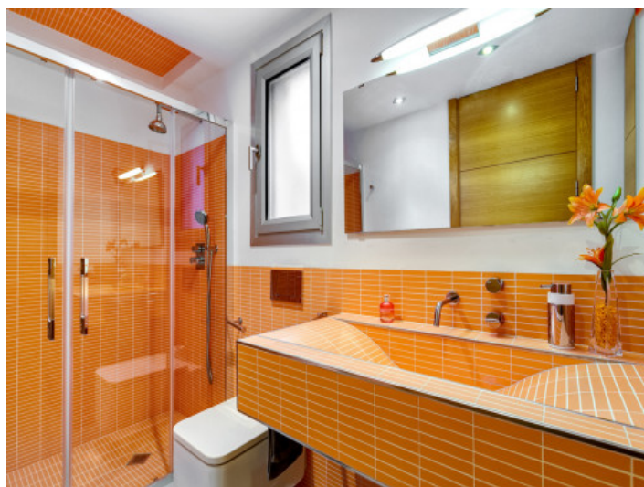
El segundo baño en naranja