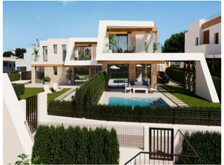
Chalet con piscina