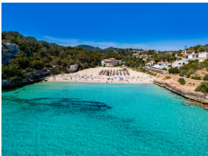
Playa cerca de la casa