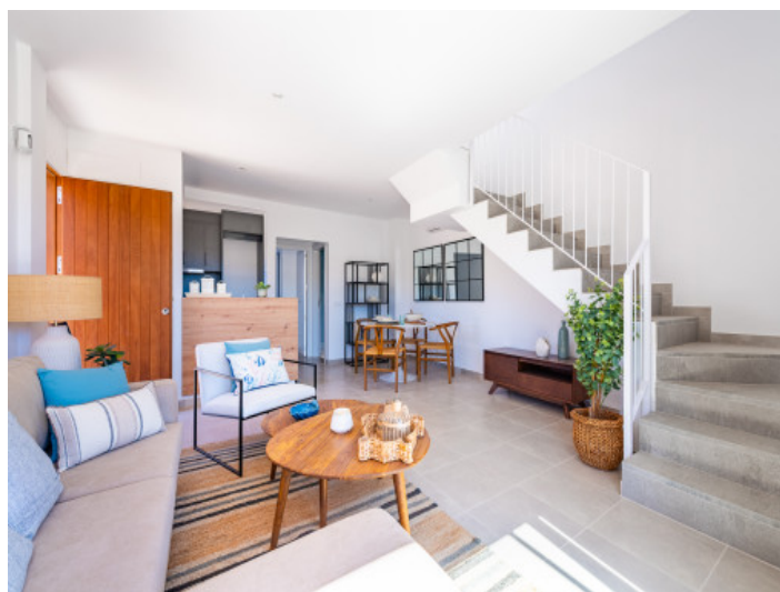
Salón - Comedor