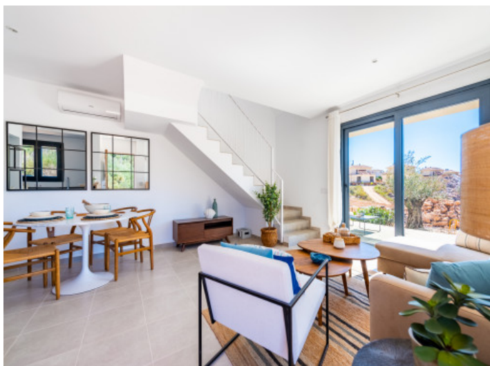
Salón - Comedor