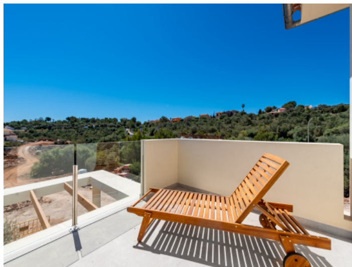
Terraza primera planta