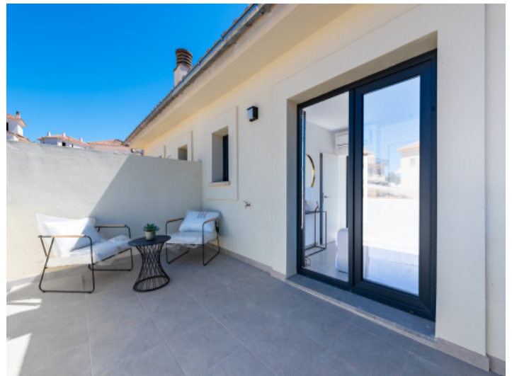
Terraza primera piso