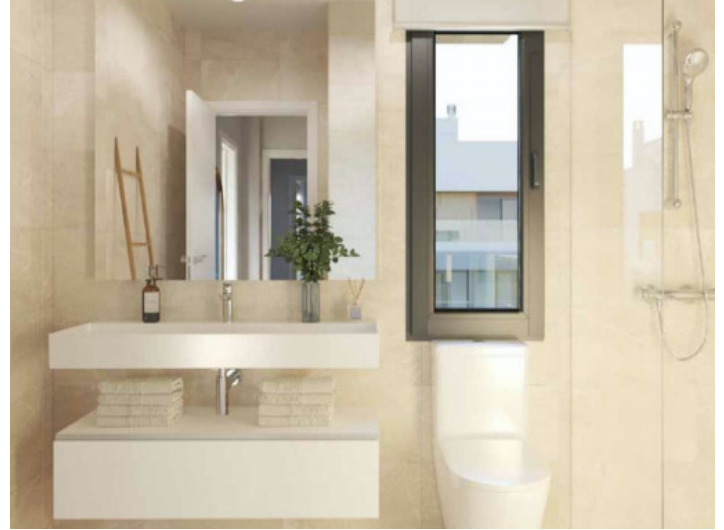
Uno de 3 cuartos de baño