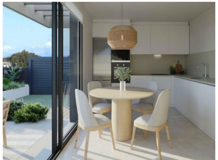
Cocina con office

Toda la información como mejor se puede saber, salvo por error durante el periodo de venta. Sirva este documento como un informe previo, las bases legales solo serán validas a traves de un contrato de compra acordado ante Notario.