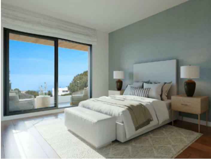
Uno de 4 dormitorios