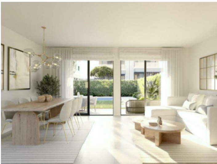
Salón-comedor con vistas a la piscina