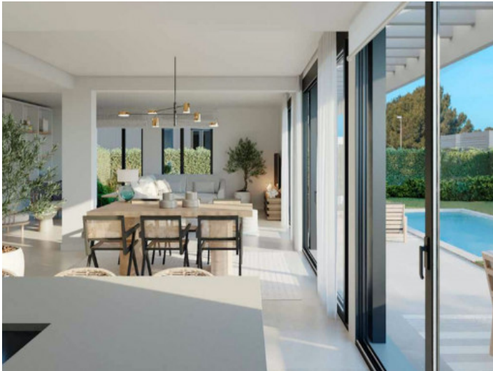
Salón-comedor con salida a la terraza