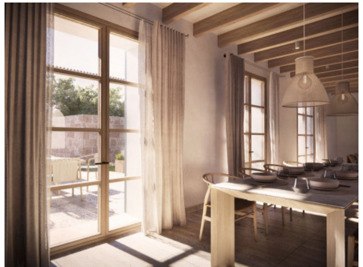
Acceso a la terraza