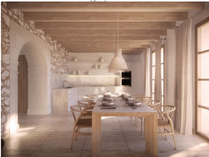
Comedor y piscina