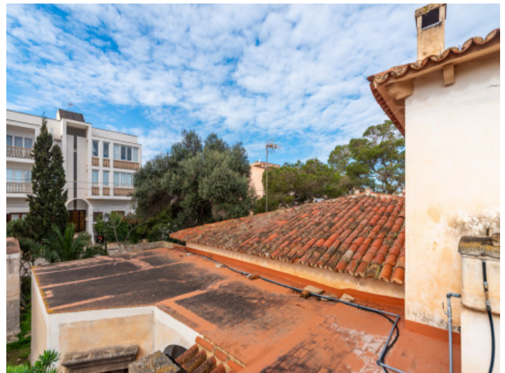
Vistas desde el primer piso