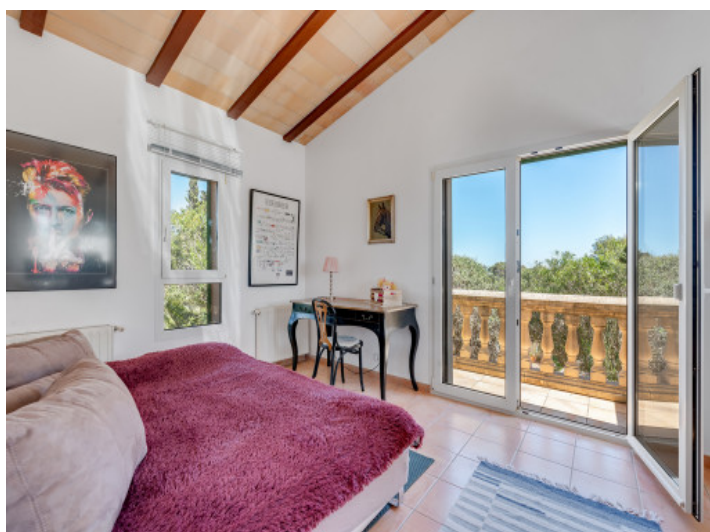
Uno de 4 dormitorios