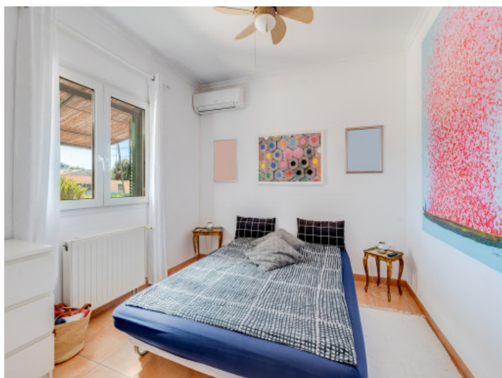
Uno de 4 dormitorios