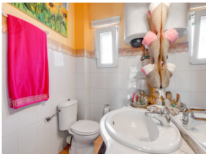
Uno de 3 baños