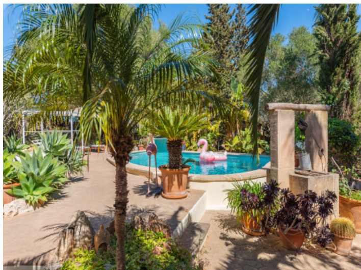
Zona de piscina