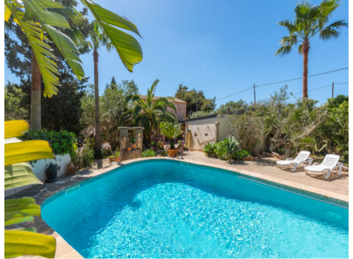
Zona de piscina