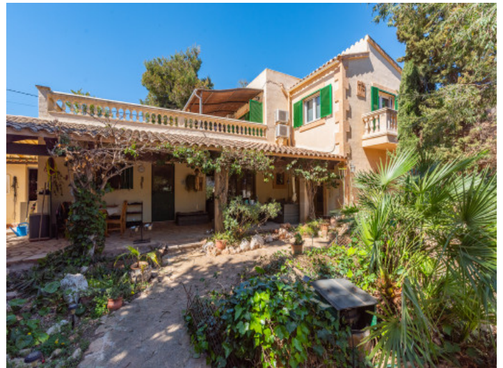
Vista exterior de la finca

Toda la información como mejor se puede saber, salvo por error durante el periodo de venta. Sirva este documento como un informe previo, las bases legales solo serán válidas a través de un contrato de compra acordado ante Notario.