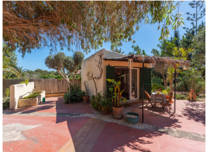
Casa para los invitados