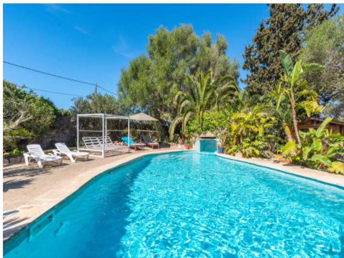
Zona de piscina