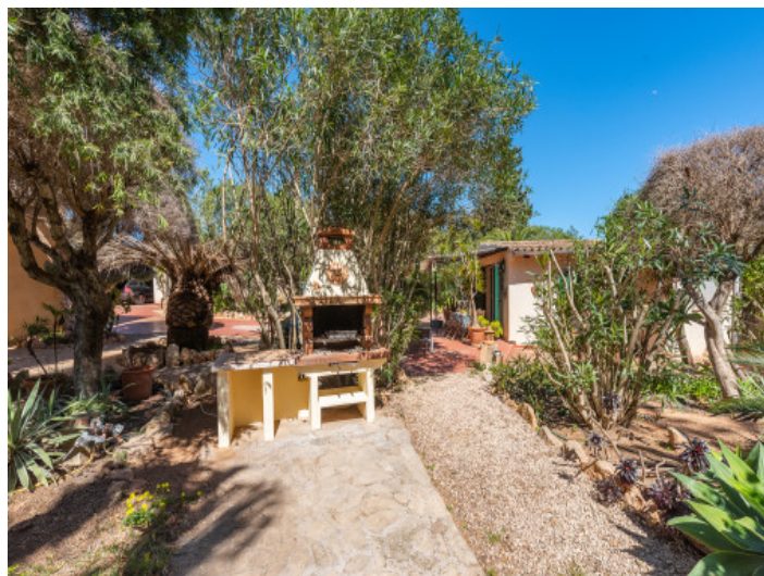
Área de barbacoa