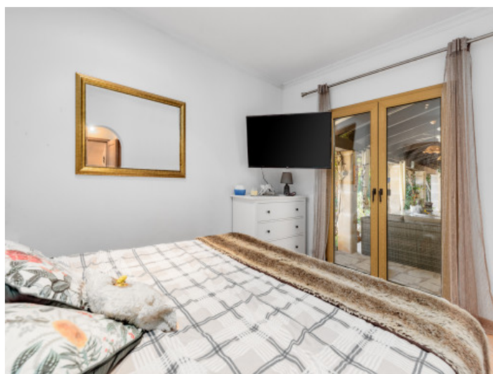
Uno de 4 dormitorios

Toda la información como mejor se puede saber, salvo por error durante el periodo de venta. Sirva este documento como un informe previo, las bases legales solo serán válidas a través de un contrato de compra acordado ante Notario.