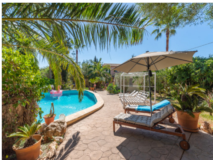
Zona de piscina con tumbonas