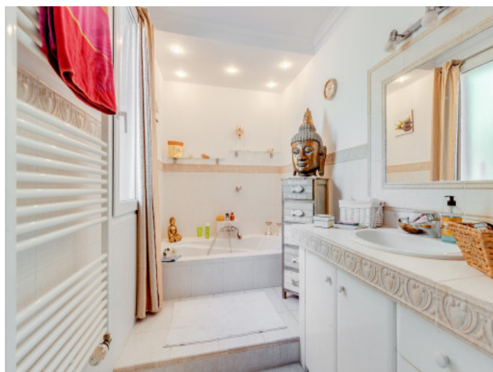
Uno de 3 baños