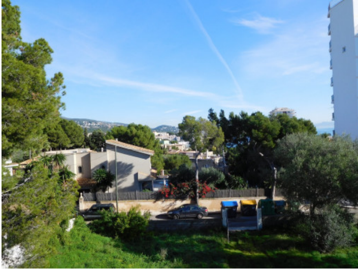
Vistas parciales al mar