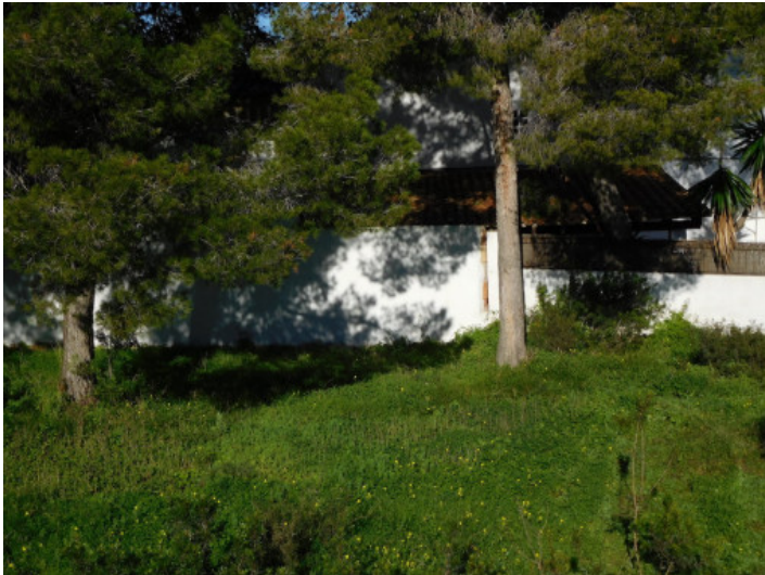
Vista al terreno