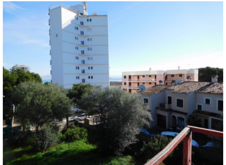
Vista al terreno

Toda la información como mejor se puede saber, salvo por error durante el periodo de venta. Sirva este documento como un informe previo, las bases legales solo serán válidas a través de un contrato de compra acordado ante Notario.