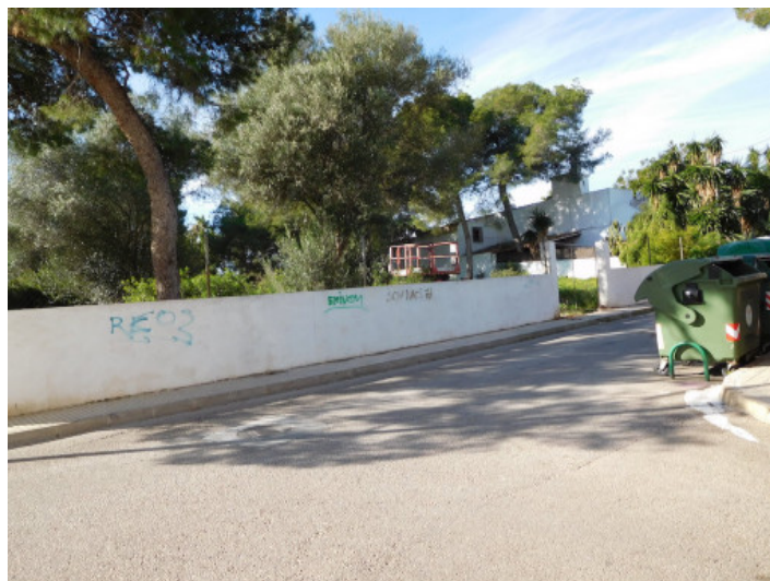
Vista de la calle