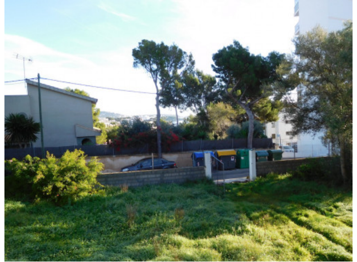
Vista del terreno