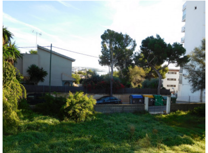
Vista al terreno