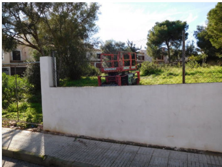
Vista de la calle