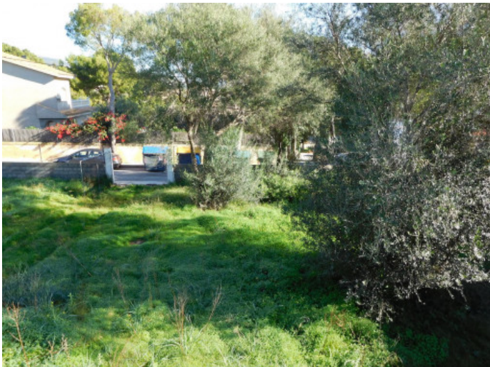
Vista al terreno