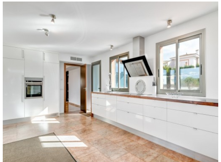
Cocina totalmente equipada