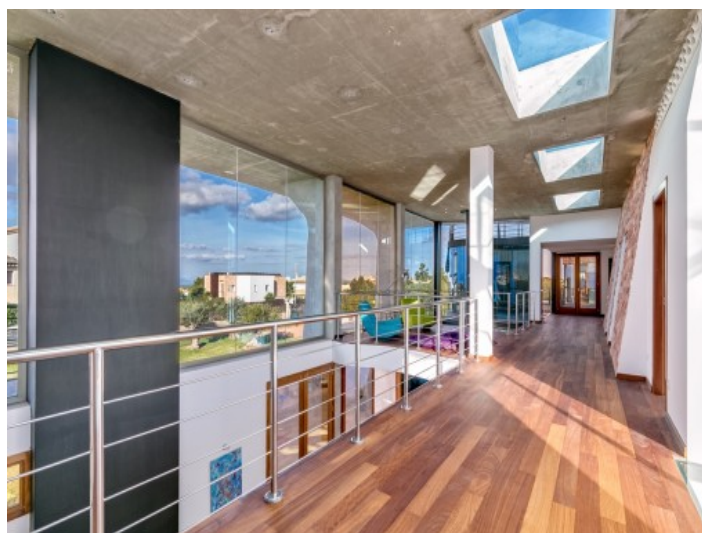
Galería extensa con zona de estar