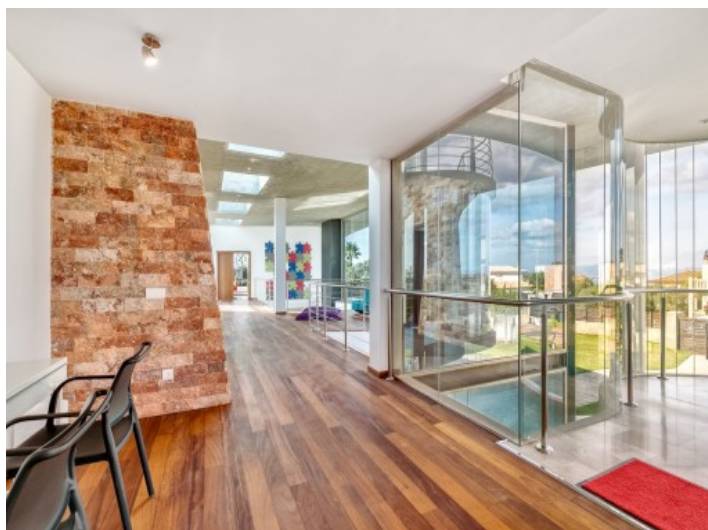
Los áreas completamente acristalados son un highlight