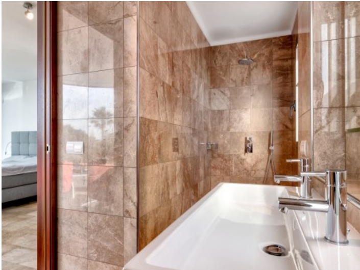
Baño principal en suite con ducha