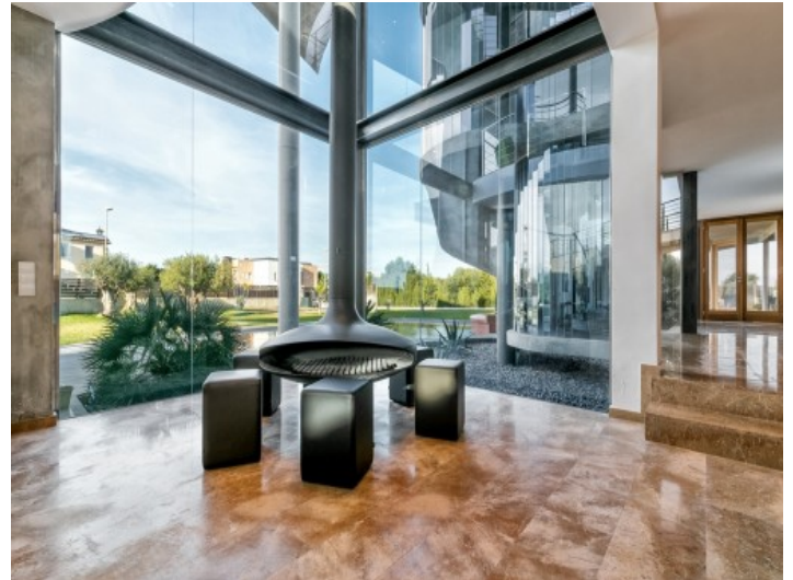
Zona de estar refinada con vistas al jardín y chimenea