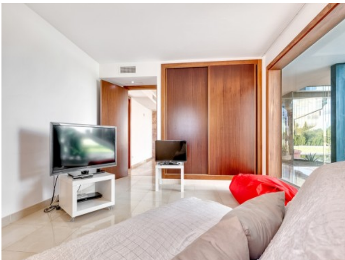
Habitación de invitados con armario empotrado