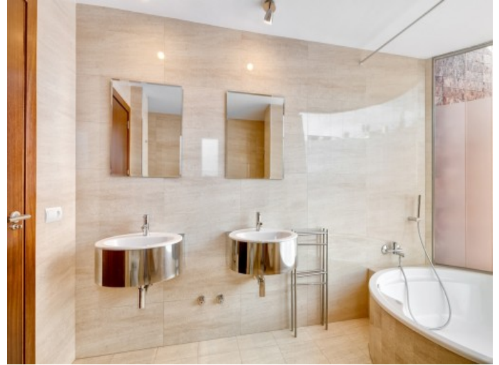
Baño noble con bañera y luz natural