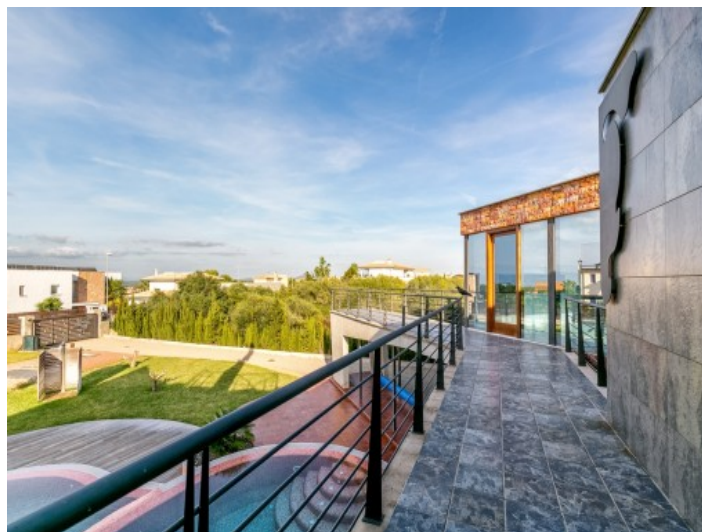
La chalet teiene una separada casa de invitados