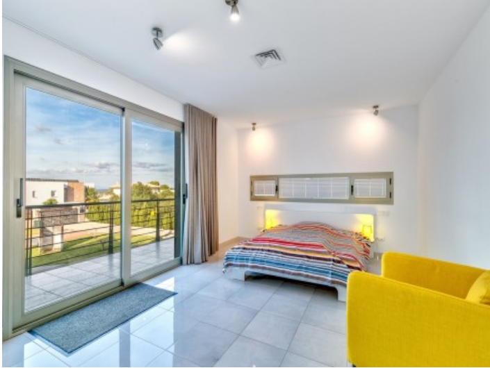
Dormitorio doble con acceso al balcón