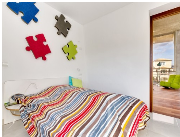
Un otro dormitorio en la planta superior