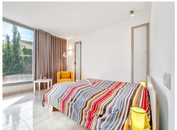
Agradable dormitorio de invitados

Toda la información como mejor se puede saber, salvo por error durante el periodo de venta. Sirva este documento como un informe previo, las bases legales solo serán válidas a través de un contrato de compra acordado ante Notario.