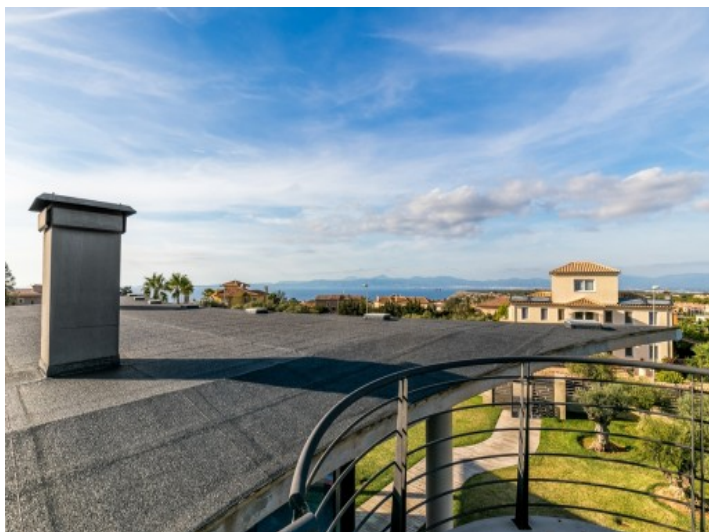
Preciosas vistas panorámicas