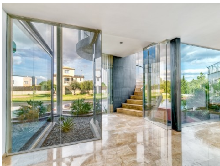
Vistas al jardín y a la piscina desde la planta baja

Toda la información como mejor se puede saber, salvo por error durante el periodo de venta. Sirva este documento como un informe previo, las bases legales solo serán validas a traves de un contrato de compra acordado ante Notario.