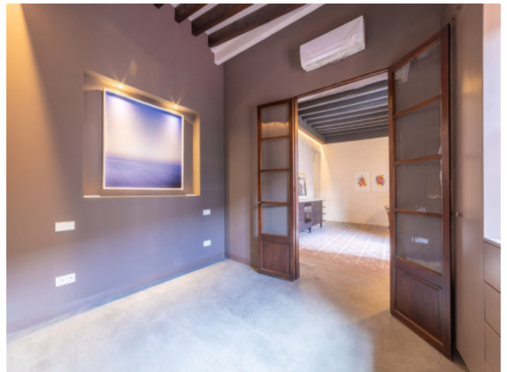
Piso con 2 dormitorios