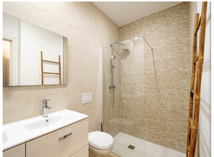
Uno de 2 baños