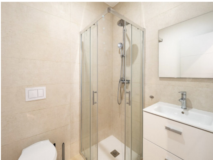
Uno de 2 baños