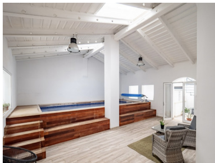
Zona de Spa