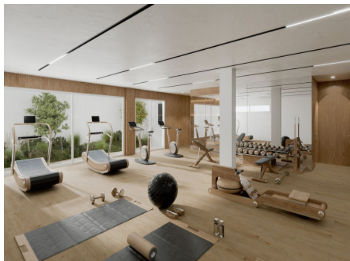
Sala de fitness con sauna