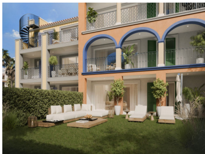
Cada apartamento de la planta baja incluye un jardín privado