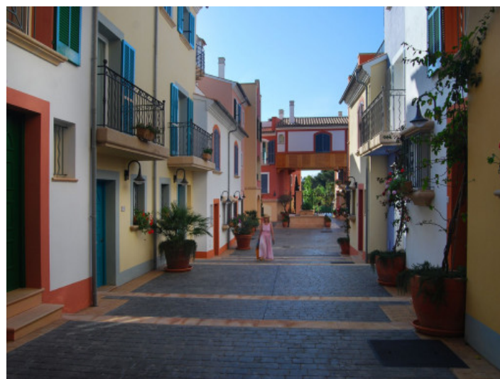
Paisaje urbano en la comunidad cerrada