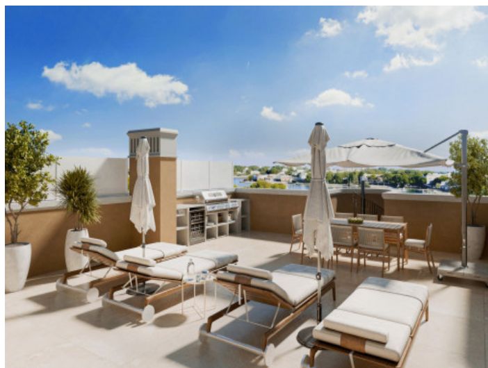
Cada ático incluye una terraza solárium

Toda la información como mejor se puede saber, salvo por error durante el periodo de venta. Sirva este documento como un informe previo, las bases legales solo serán validas a traves de un contrato de compra acordado ante Notario.