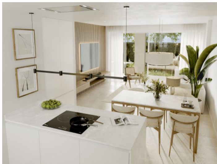
Cocina y comedor