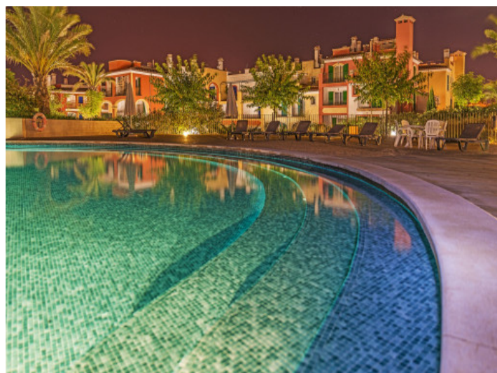
Piscina comunitaria de 700 m 2