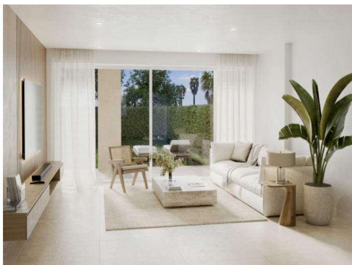
Sala de estar en la planta baja