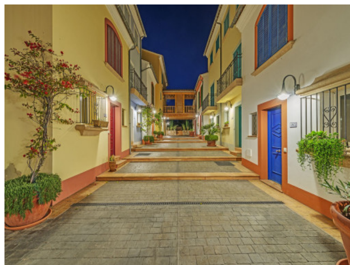
Paisaje urbano en la comunidad cerrada