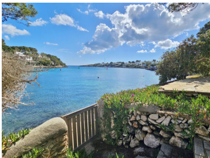
Acceso al mar