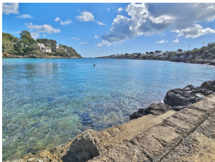
Acceso al mar