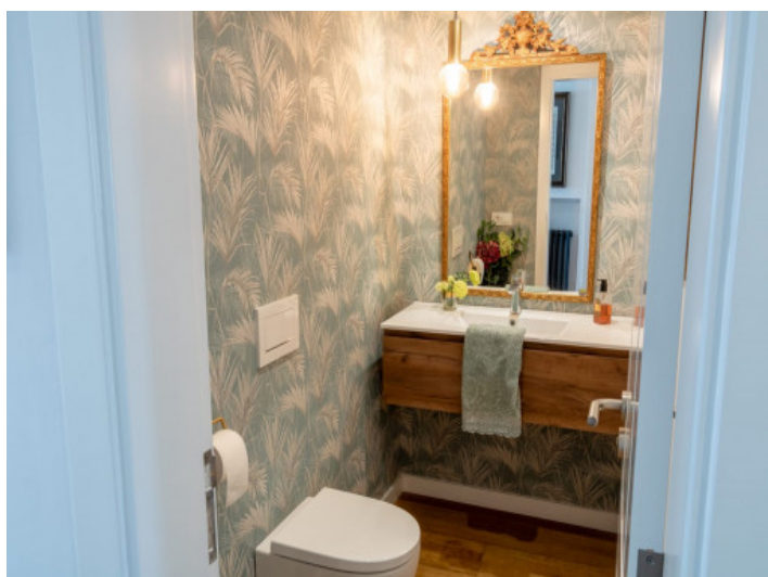
Aseo de invitados