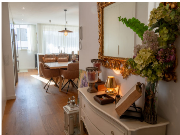
Zona de entrada