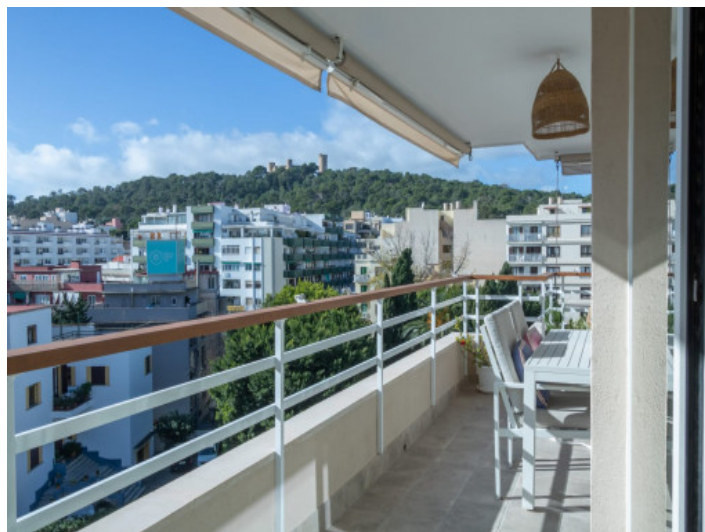
Amplia terraza con vistas al castillo de Bellver