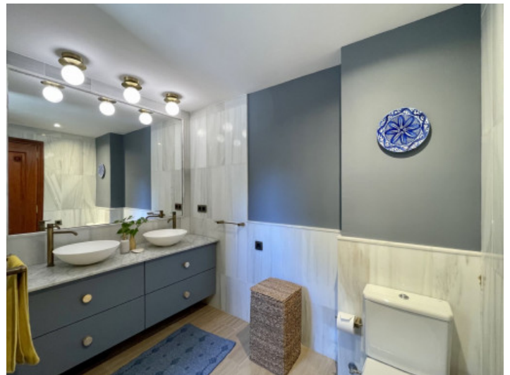
Uno de los dos baños