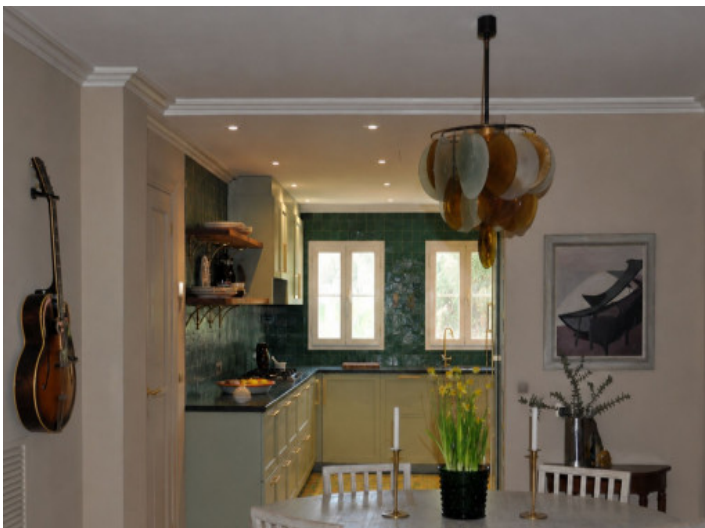
Zona de estar y cocina Miele completamente equipada