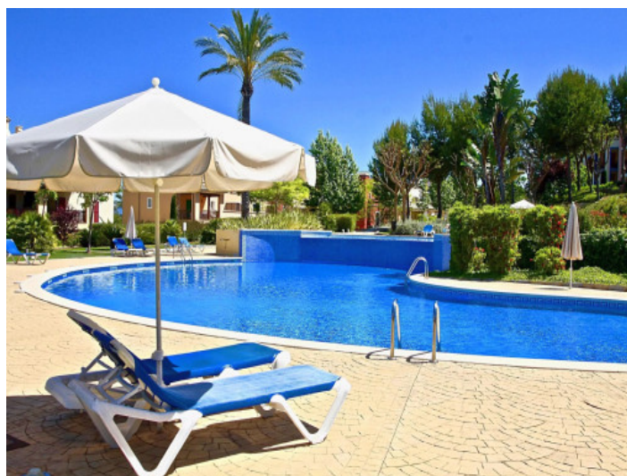
Una de las tres piscinas

Toda la información como mejor se puede saber, salvo por error durante el periodo de venta. Sirva este documento como un informe previo, las bases legales solo serán válidas a través de un contrato de compra acordado ante Notario.