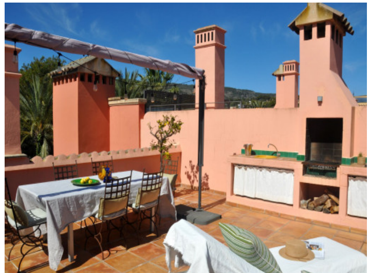
Terraza con zona de barbacoa