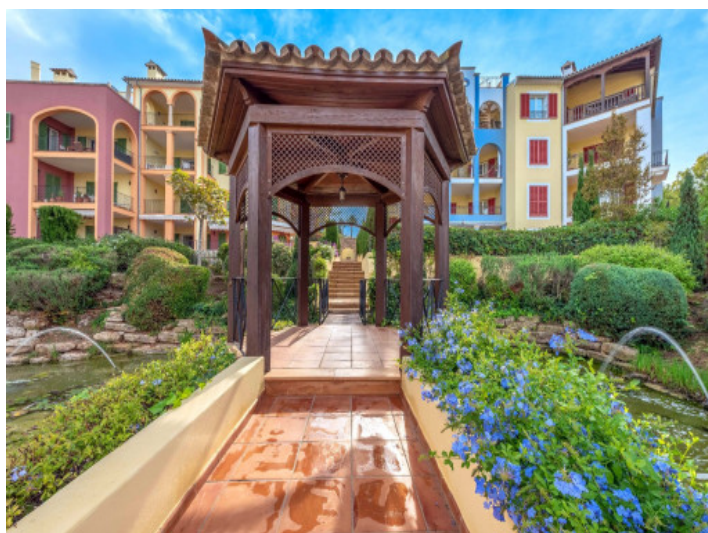
Urbanización en Bendinat, cerca del mar y del campo de golf