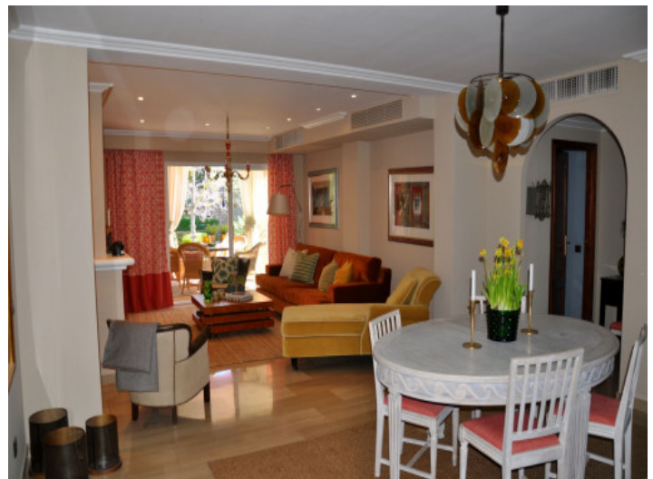
Acogedora zona de estar

Toda la información como mejor se puede saber, salvo por error durante el periodo de venta. Sirva este documento como un informe previo, las bases legales solo serán válidas a través de un contrato de compra acordado ante Notario.