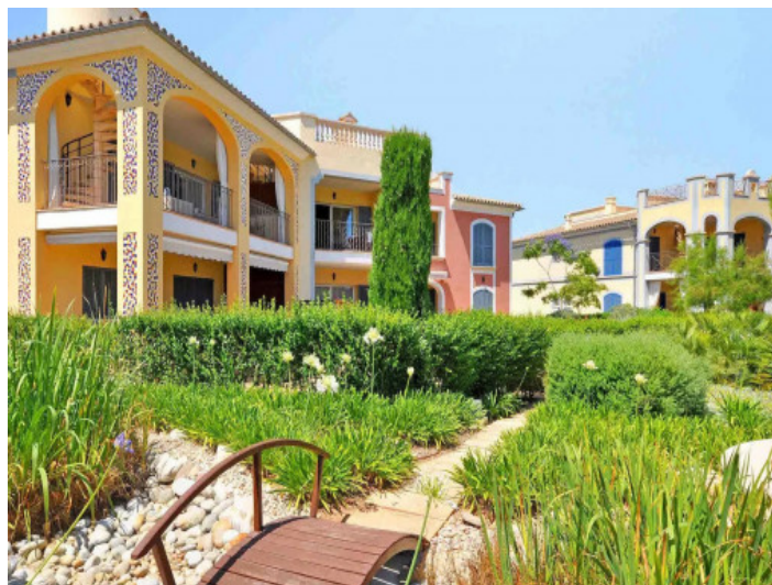
Urbanización con jardín mediterráneo