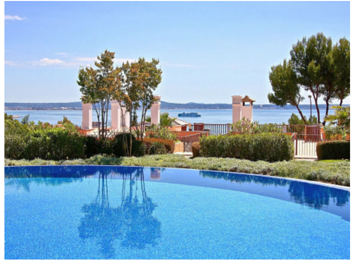
Una de las tres piscinas comunitarias con vistas al mar