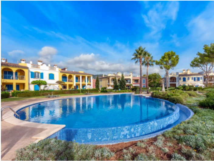
Urbanización muy cuidada en Bendinat