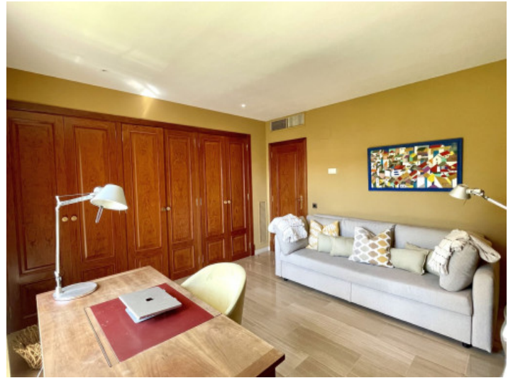
Segundo dormitorio actualmente utilizado como despacho