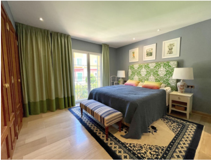
Dormitorio amplio con baño en suite