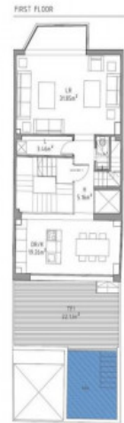
Plano de la planta baja