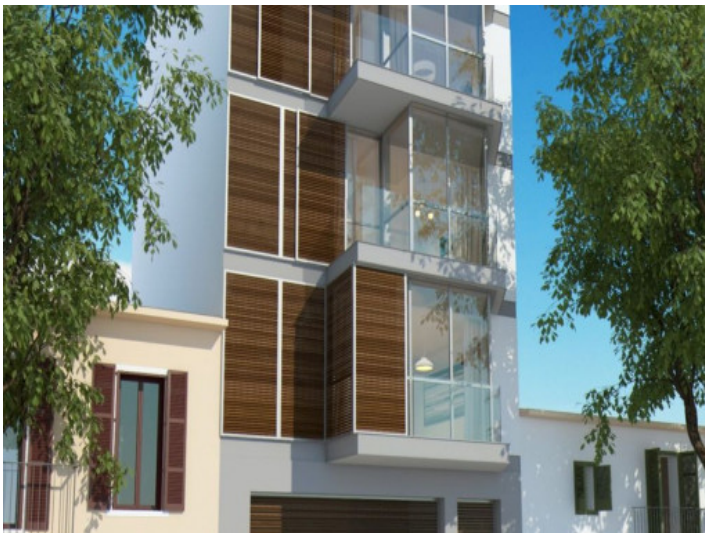
Vistas exteriores del complejo residencial