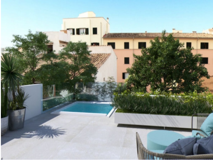
Dúplex exclusivo con piscina en Santa Catalina