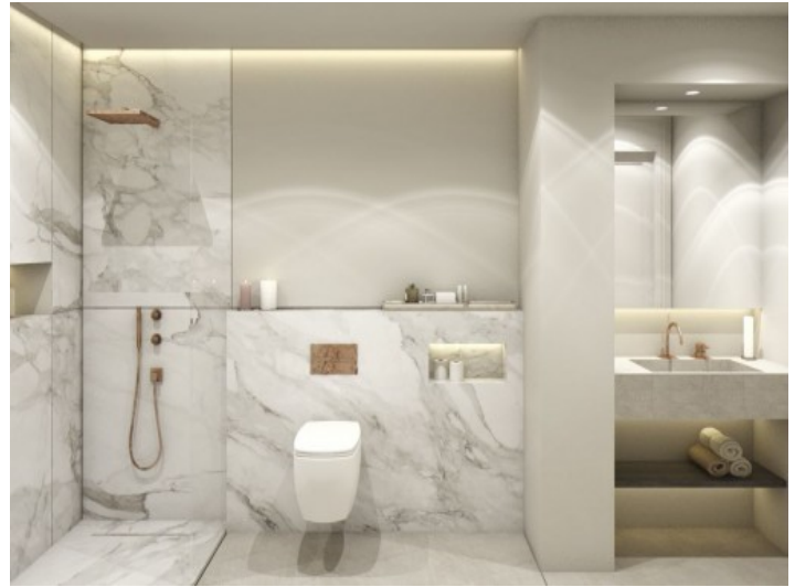
Uno de 3 baños lujosos