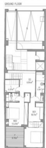
Plano de la planta baja