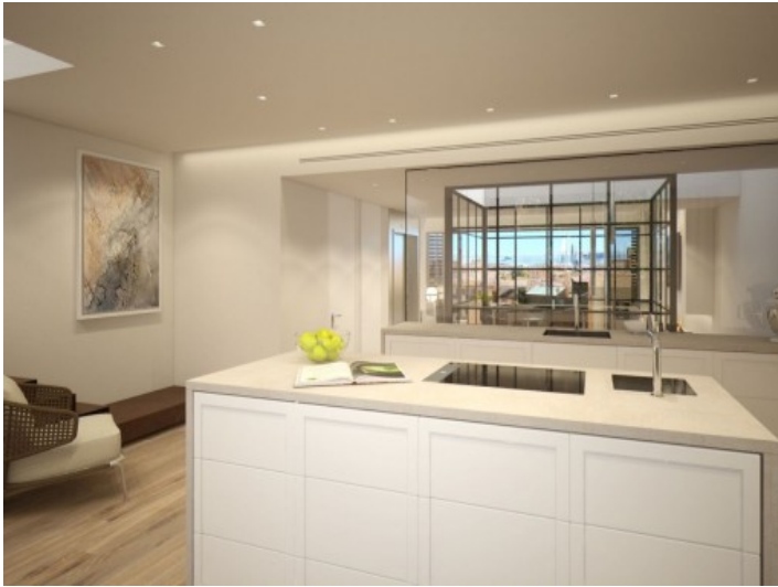
Cocina grande con isla central