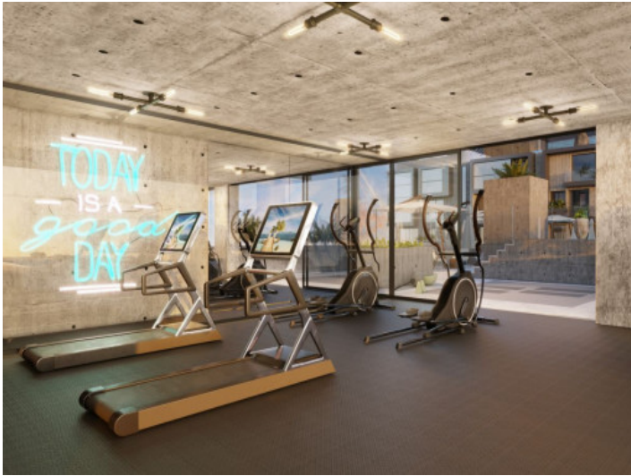
Área común con gimnasio