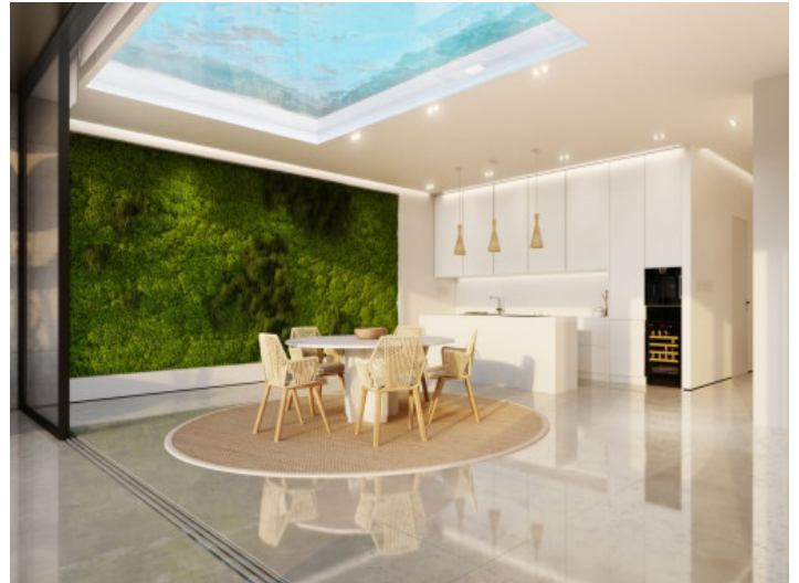
Comedor y cocina