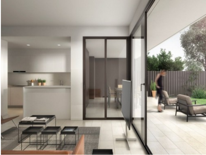
Salón abierto con acceso al jardín