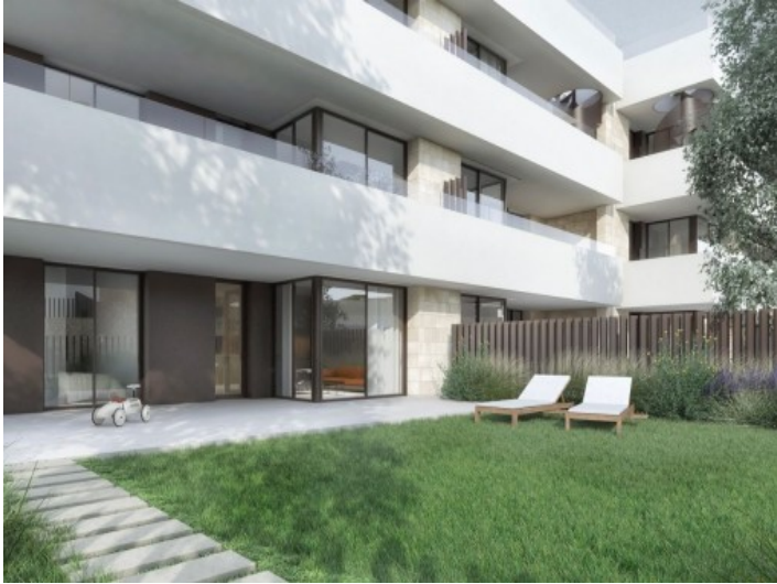
Vista al jardín