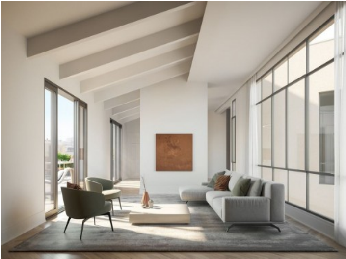
Vista a uno de los salones