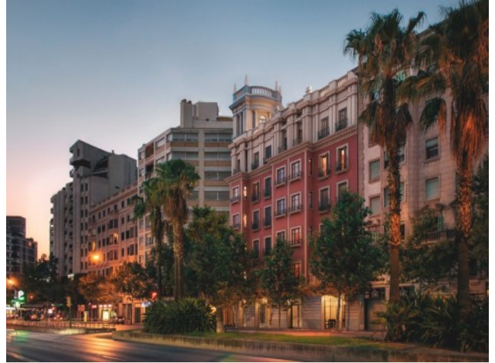
Hay 16 apartamentos en total