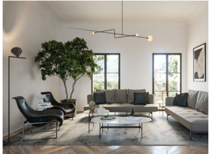
Vista a uno de los salones