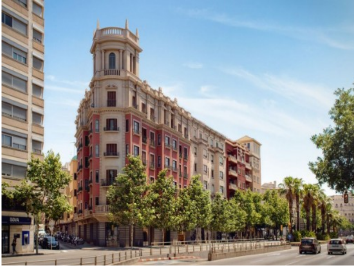
Vista exterior del edificio