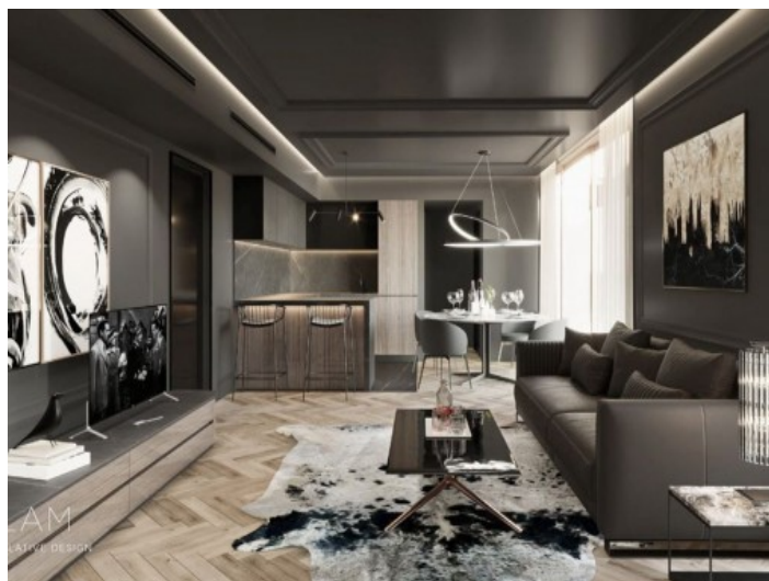
Salón-comedor - Glam

Toda la información como mejor se puede saber, salvo por error durante el periodo de venta. Sirva este documento como un informe previo, las bases legales solo serán válidas a través de un contrato de compra acordado ante Notario.