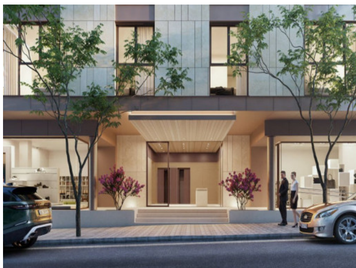
Área de entrada