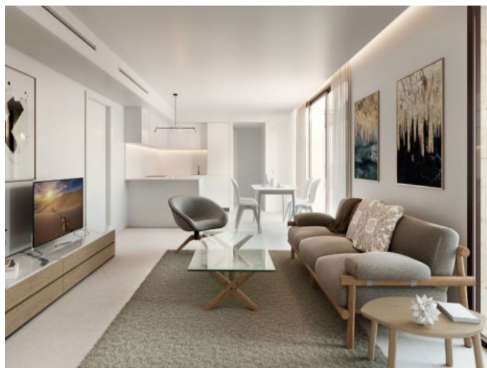
Salón-comedor - Light

Toda la información como mejor se puede saber, salvo por error durante el periodo de venta. Sirva este documento como un informe previo, las bases legales solo serán válidas a través de un contrato de compra acordado ante Notario.