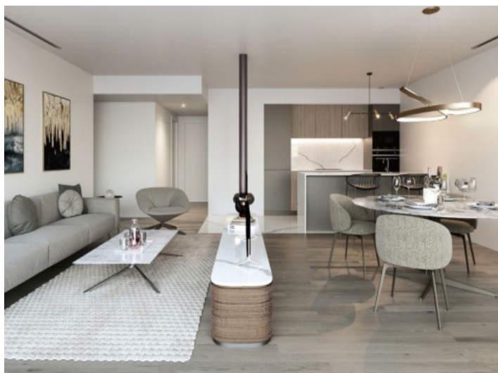
Salón-comedor - Shine