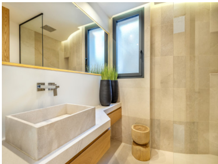
Badezimmer Grup Vial