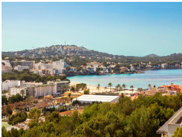
Moderno ático en complejo de nueva construcción con excelentes vistas