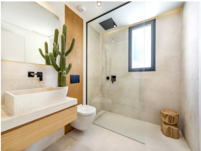
Badezimmer 2 Grup Vial