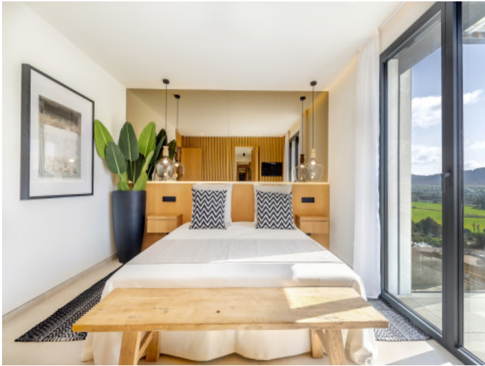
Eines von 4 Schlafzimmer