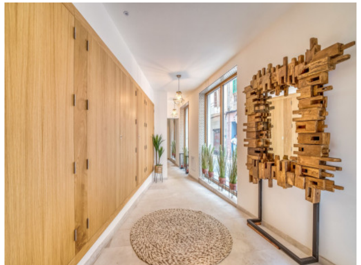
Entrada comunitaria al edificio