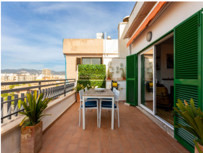
Terraza con comedor