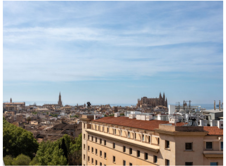
Vistas sobre Palma