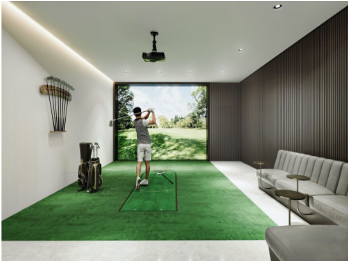
Simulador de golf