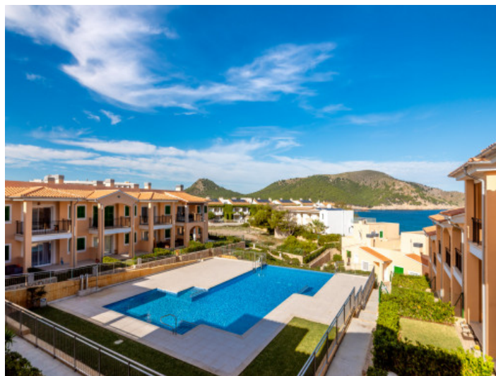
Complejo y piscina