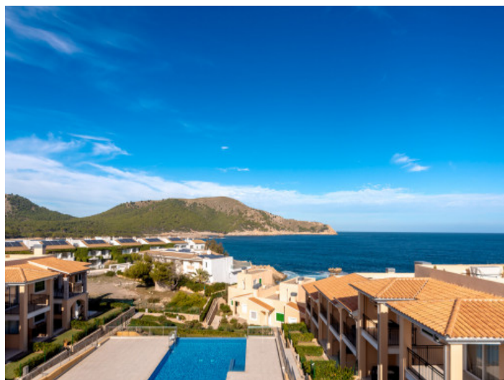
Vistas al mar

Toda la información como mejor se puede saber, salvo por error durante el periodo de venta. Sirva este documento como un informe previo, las bases legales solo serán válidas a través de un contrato de compra acordado ante Notario.