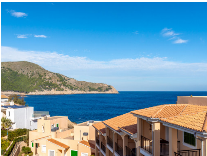
Vistas al mar