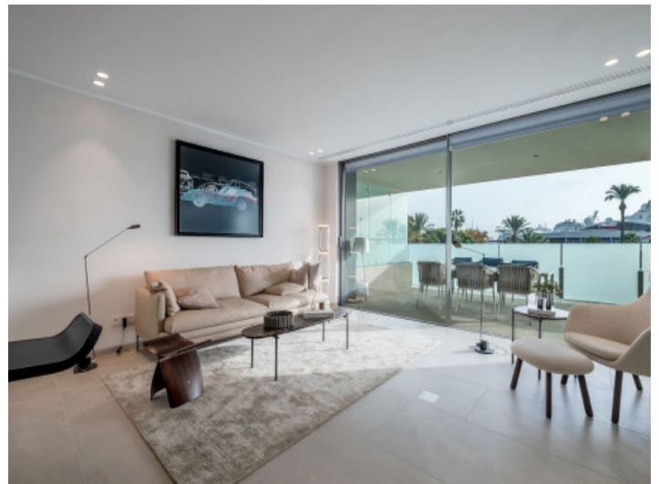
Salón - comedor