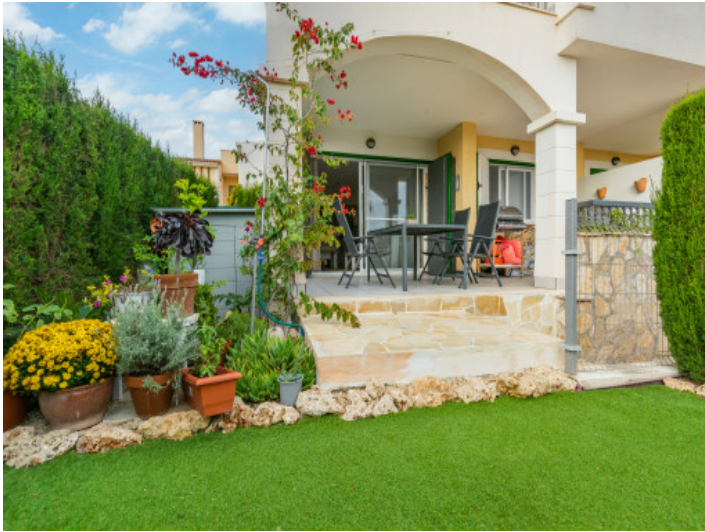
Terraza y jardín