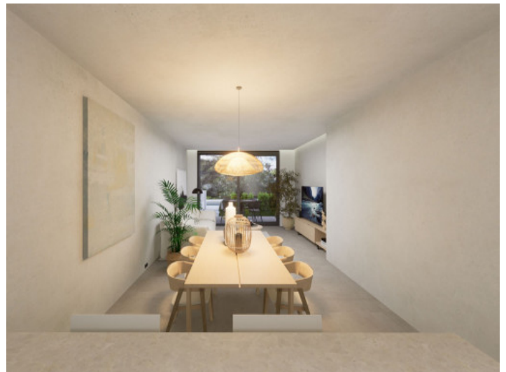
Salón y comedor abierto