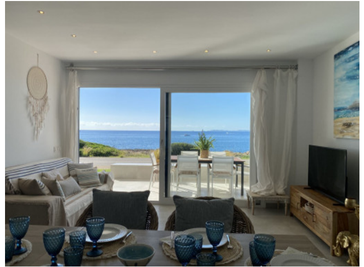
Salón con vistas al mar