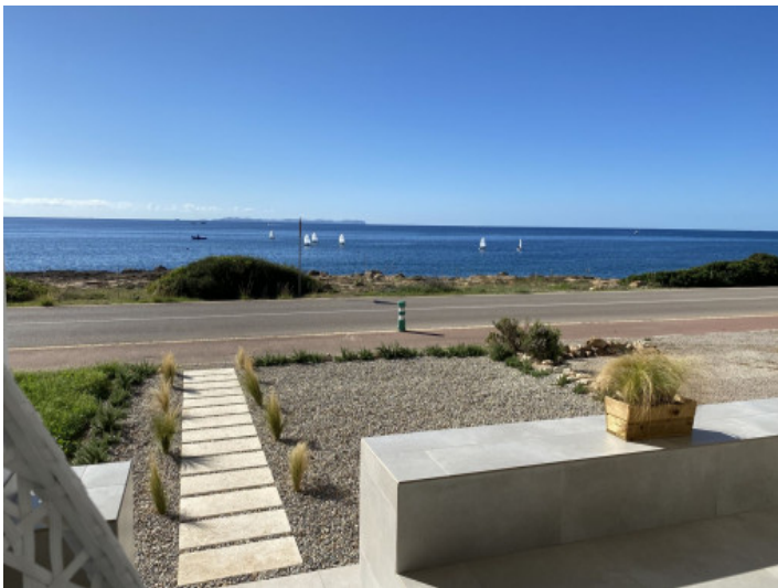
Vista mar frontal