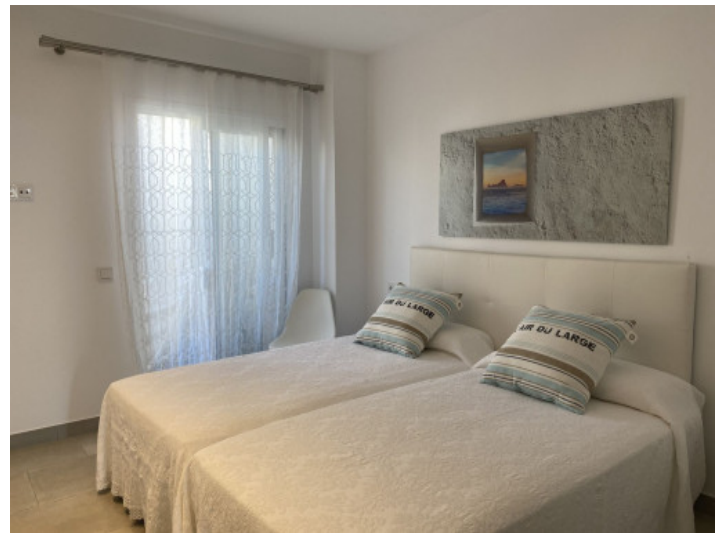
Uno de 3 dormitorios