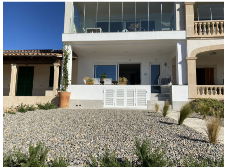
Vistas al piso

Toda la información como mejor se puede saber, salvo por error durante el periodo de venta. Sirva este documento como un informe previo, las bases legales solo serán válidas a traves de un contrato de compra acordado ante Notario.