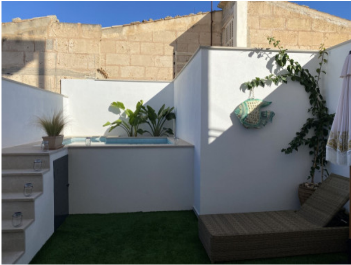
Patio con piscina