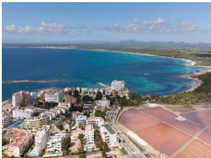
Colonia Sant Jordi