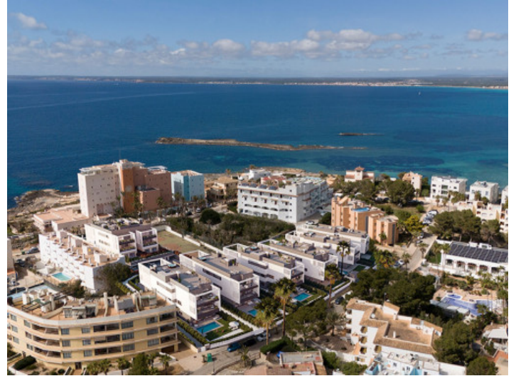
Colonia Sant Jordi