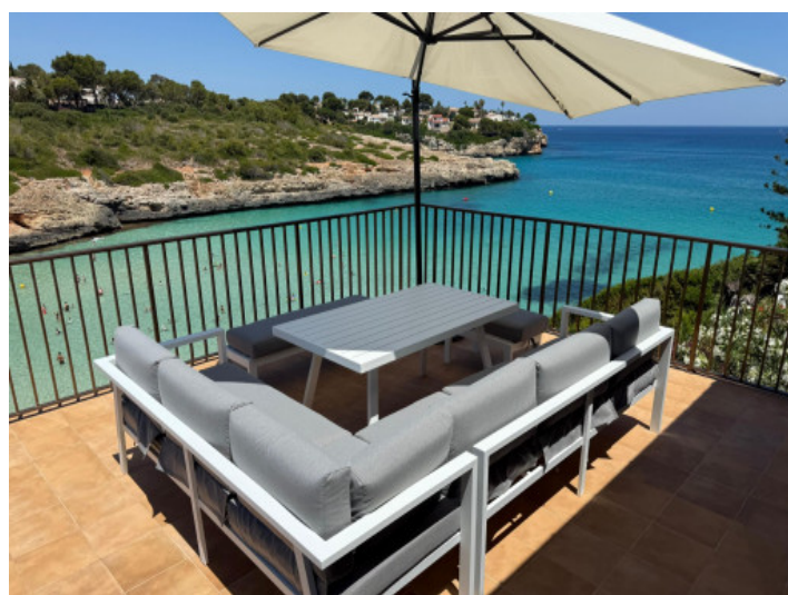
Balcón con vistas al mar