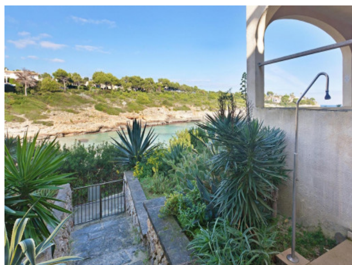
Acceso a la playa