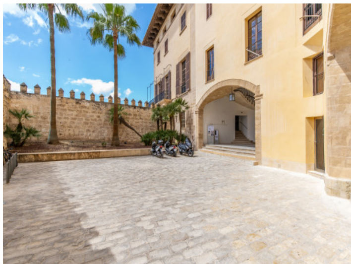
Ubicación soñada con un entorno maravilloso