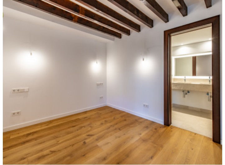
Dormitorio principal con baño en suite