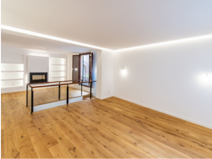
Impresionante sala de estar y comedor