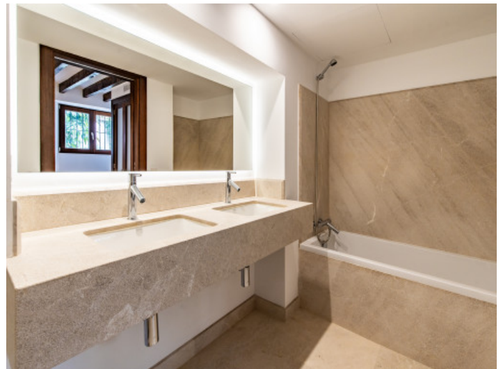
Uno de los dos baños con ducha y bañera