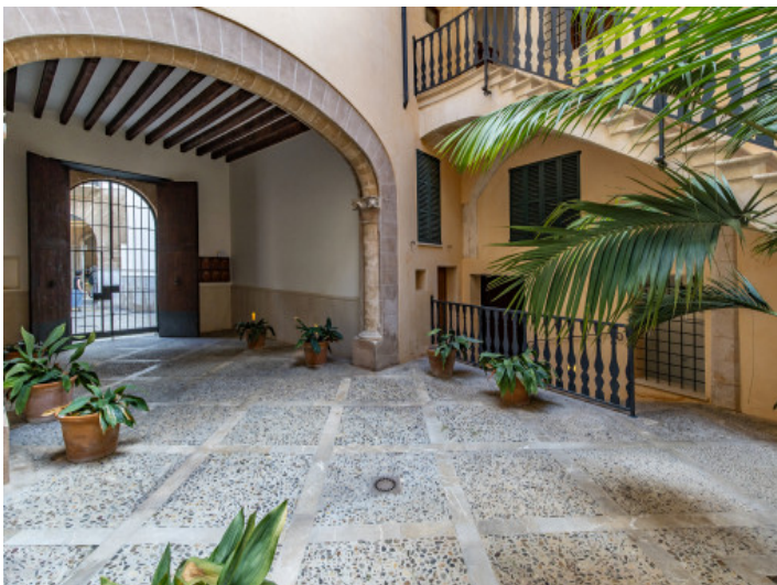
Apartamento exclusivo en el casco antiguo en un palacio histórico