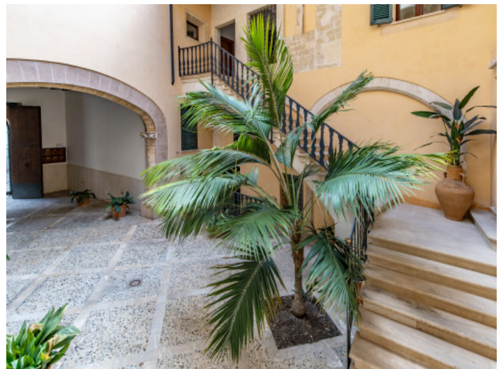
Impresionante patio interior

Toda la información como mejor se puede saber, salvo por error durante el periodo de venta. Sirva este documento como un informe previo, las bases legales solo serán válidas a través de un contrato de compra acordado ante Notario.