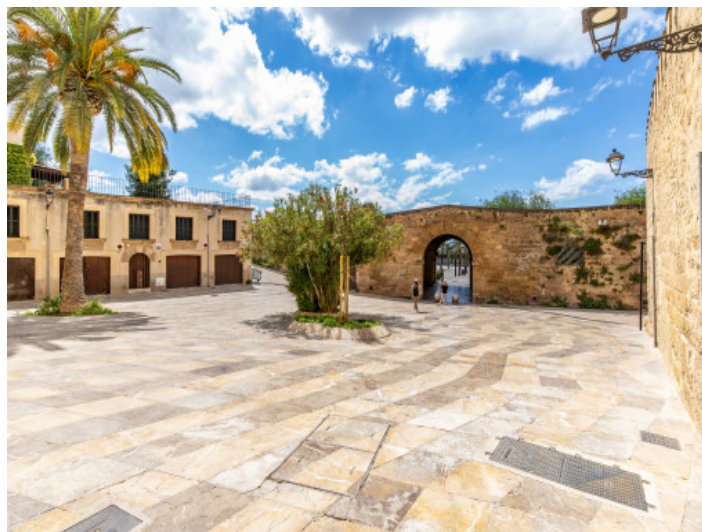
Ubicación excelente junto a la catedral