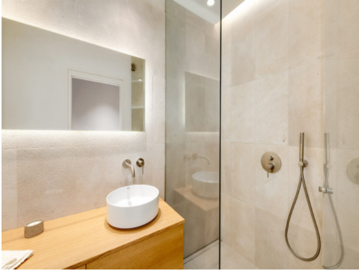
_Cuarto de baño