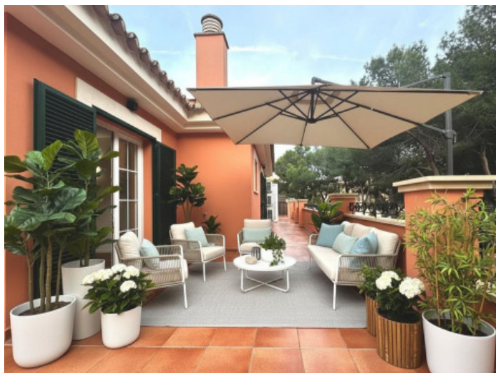
Render de una terraza acogedora