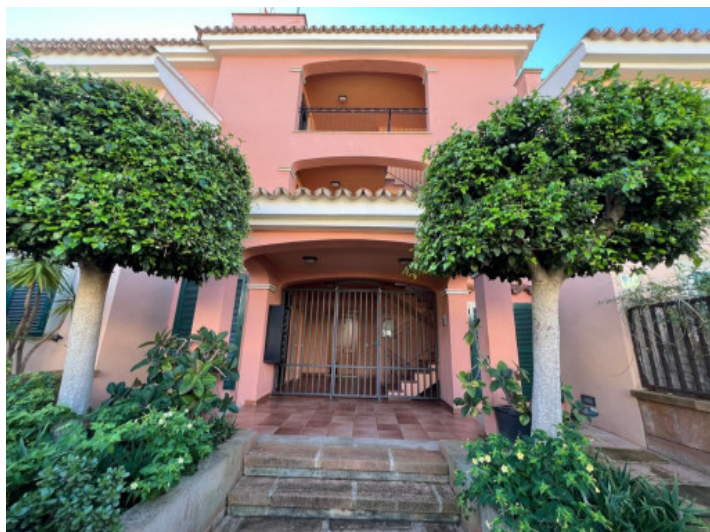
Entrada de la vivienda