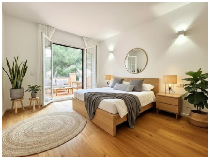
Render del dormitorio con terraza

Toda la información como mejor se puede saber, salvo por error durante el periodo de venta. Sirva este documento como un informe previo, las bases legales solo serán válidas a través de un contrato de compra acordado ante Notario.