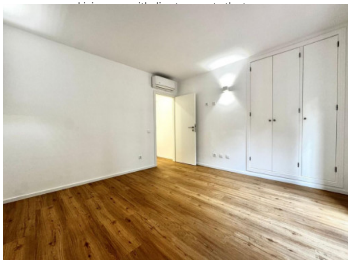
Dormitorio con armario empotrado y acceso a la terraza