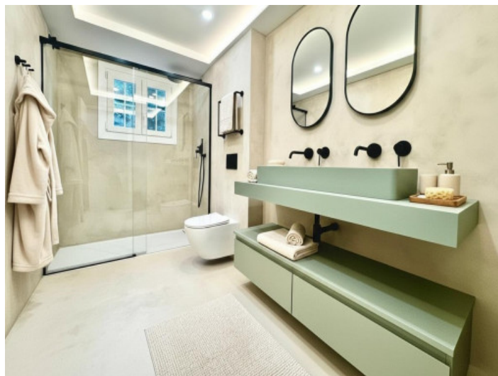
Baño elegante con ducha y ventana