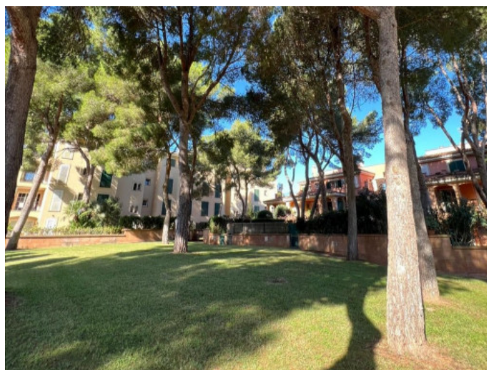
Zona exterior cuidada con árboles