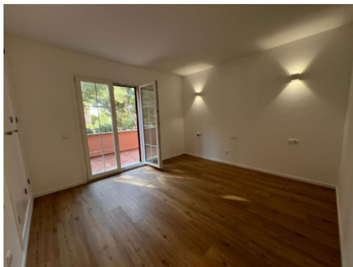
Estancia luminosa con acceso a la terraza

Toda la información como mejor se puede saber, salvo por error durante el periodo de venta. Sirva este documento como un informe previo, las bases legales solo serán válidas a través de un contrato de compra acordado ante Notario.