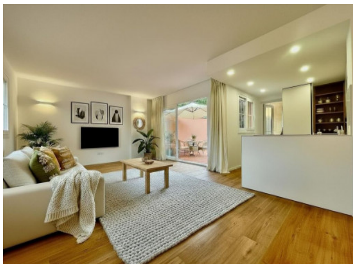
Render del salón comedor