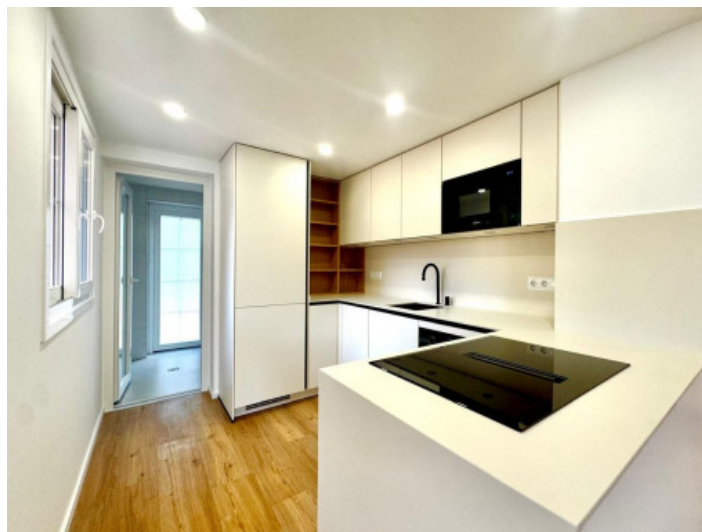
Cocina moderna equipada