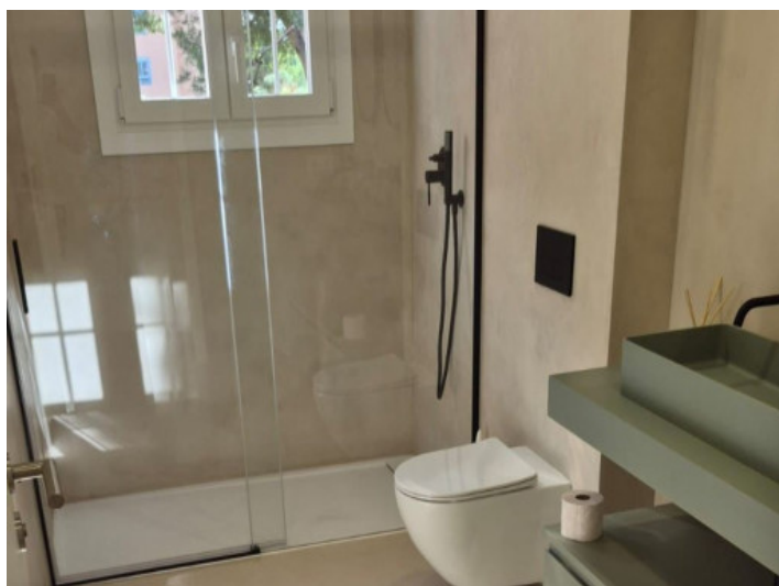
Baño elegante con ducha y ventana