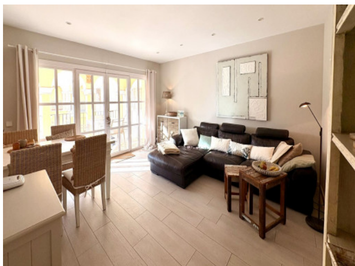
Comedor-sala de estar