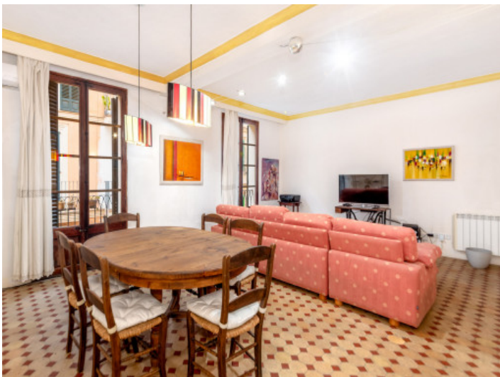
Salón comedor abierto