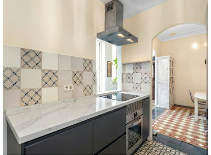
Generado por IA: posible modernización