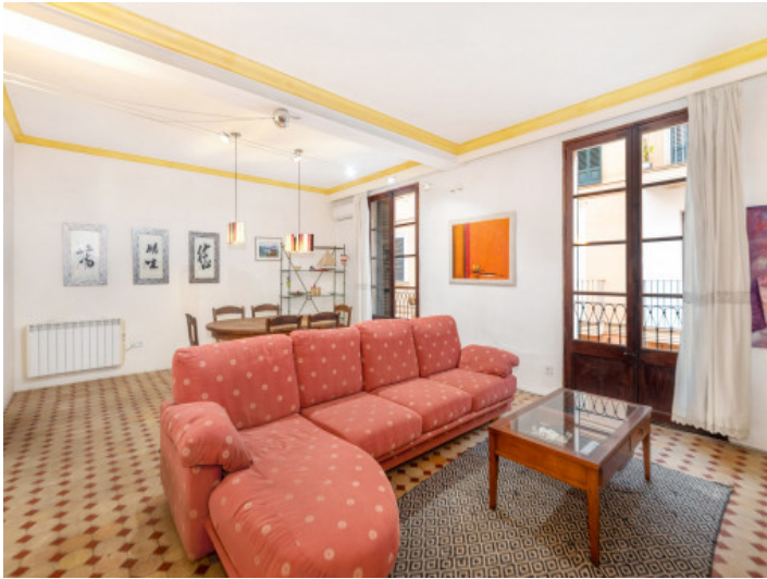
Apartamento encantador en el centro de Palma