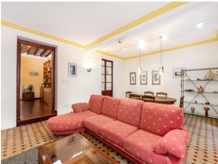
Salón comedor abierto