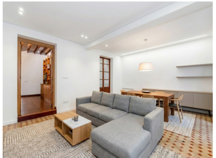
Generado por IA: posible modernización