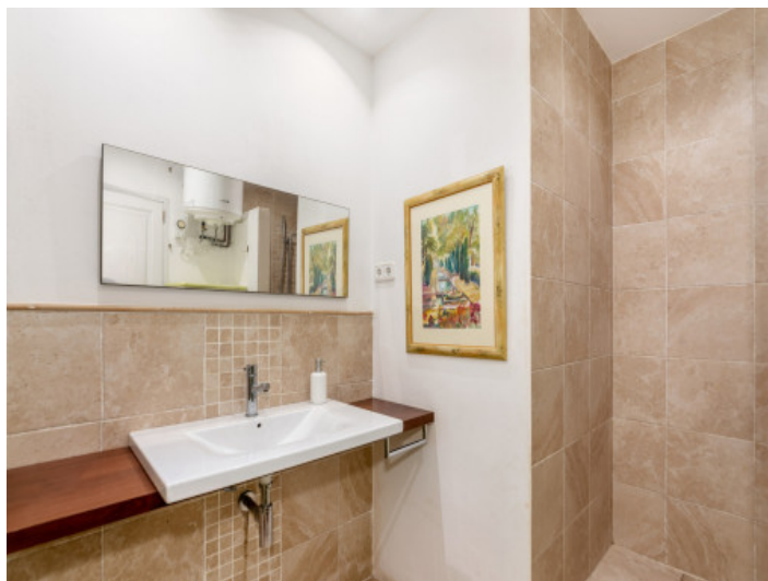
Baño en suite