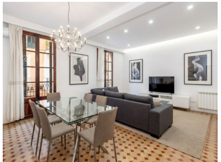
Generado por IA: posible modernización

Toda la información como mejor se puede saber, salvo por error durante el periodo de venta. Sirva este documento como un informe previo, las bases legales solo serán validas a traves de un contrato de compra acordado ante Notario.