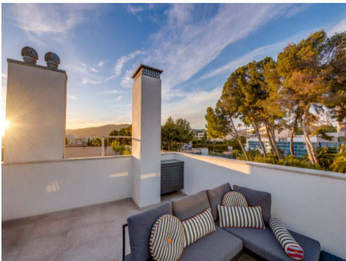
Terraza al atardecer