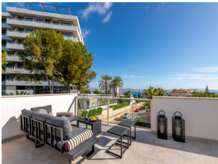
Terraza en la azotea soleada