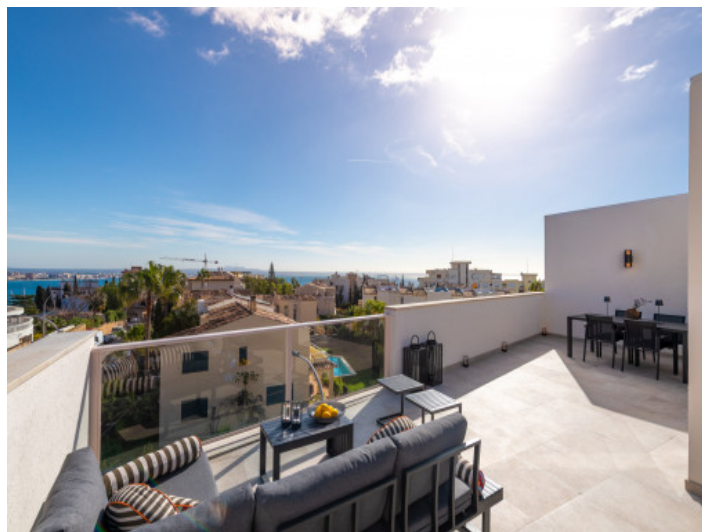
Vista panorámica desde la terraza