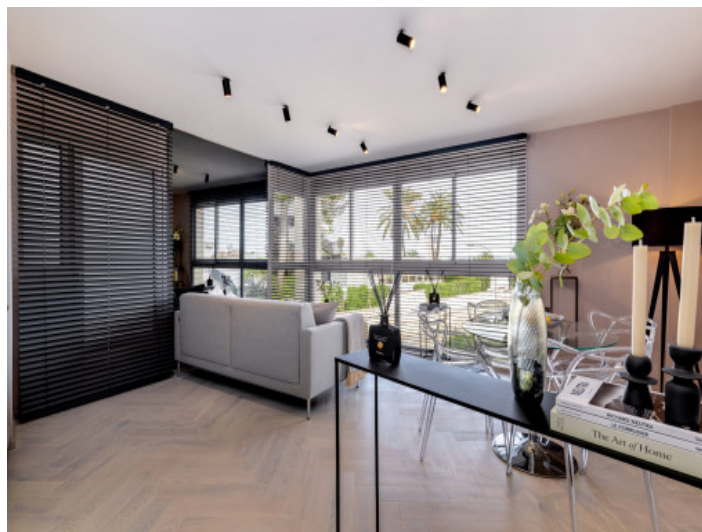
Distribución alternativa de muebles