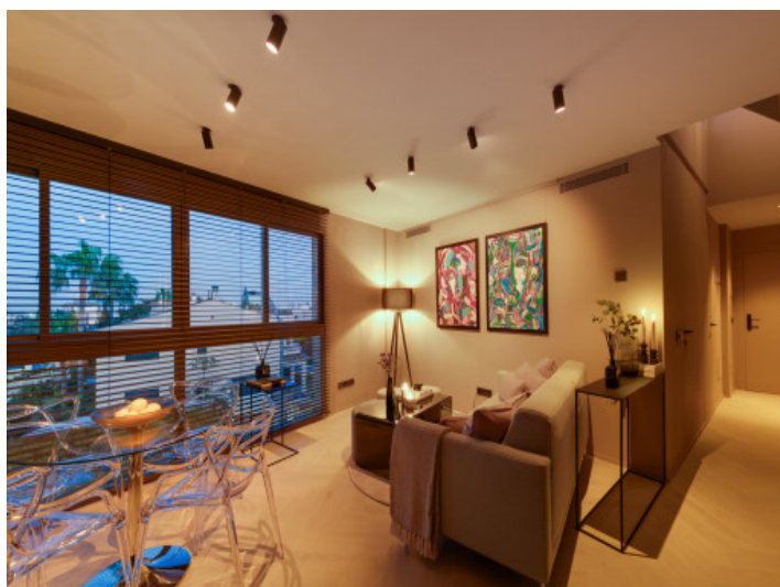
Ambiente de luz por la tarde