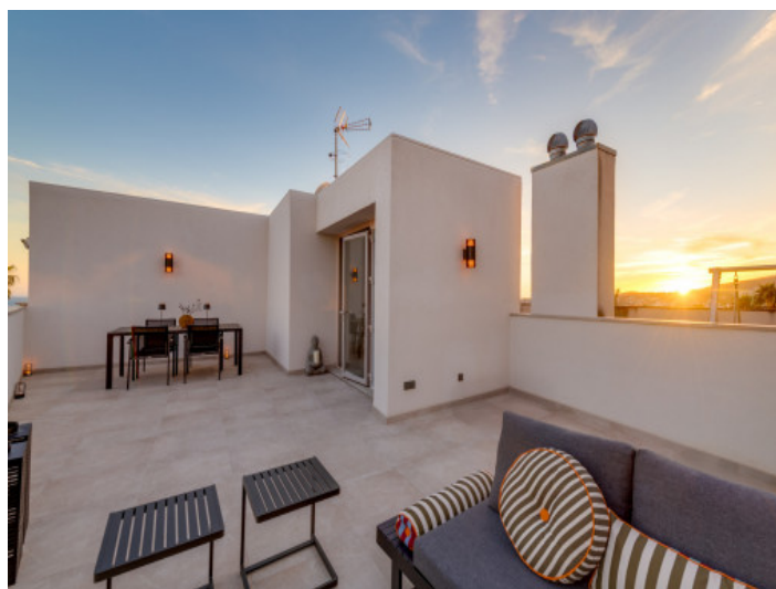
Atardecer en la terraza de la azotea