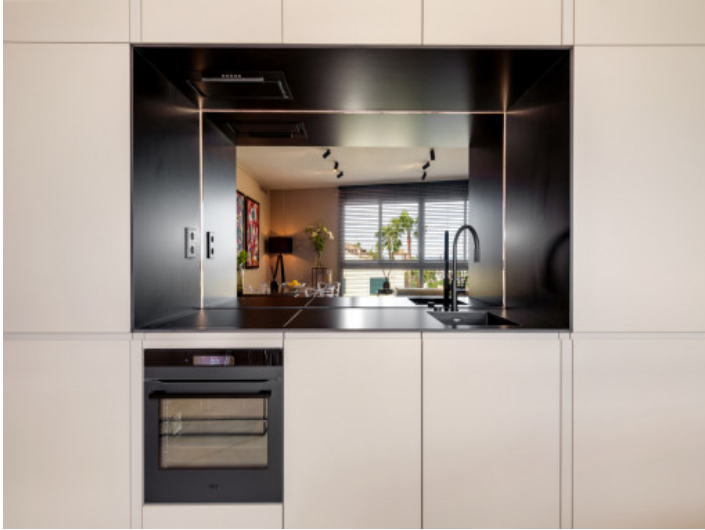
Detalles de la cocina