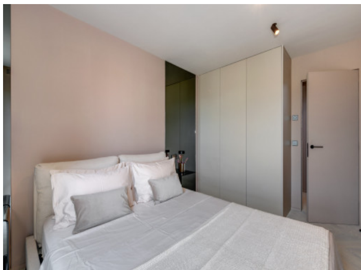
Armarios empotrados en el dormitorio