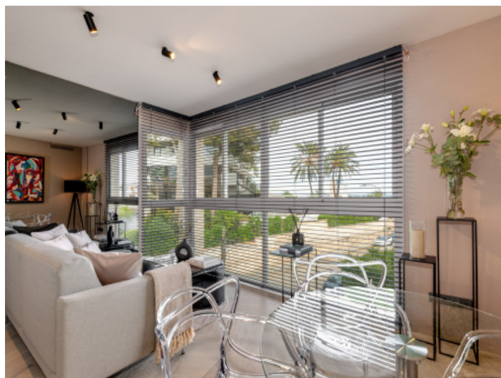
Sofá junto a la ventana

Toda la información como mejor se puede saber, salvo por error durante el periodo de venta. Sirva este documento como un informe previo, las bases legales solo serán válidas a través de un contrato de compra acordado ante Notario.