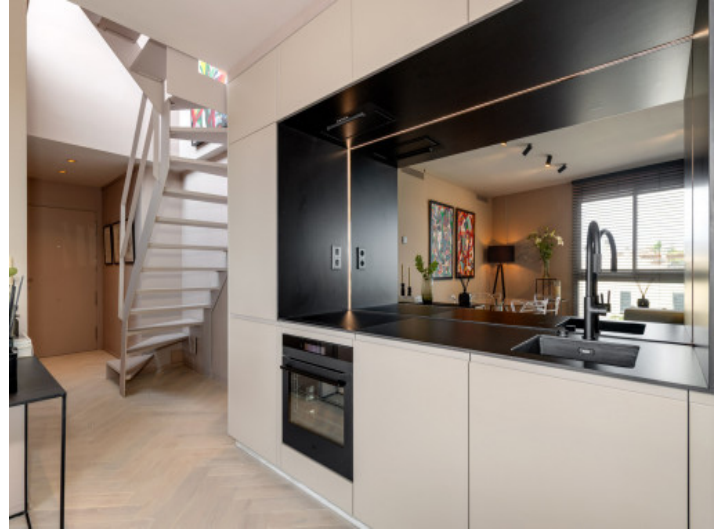
Cocina y pasillo