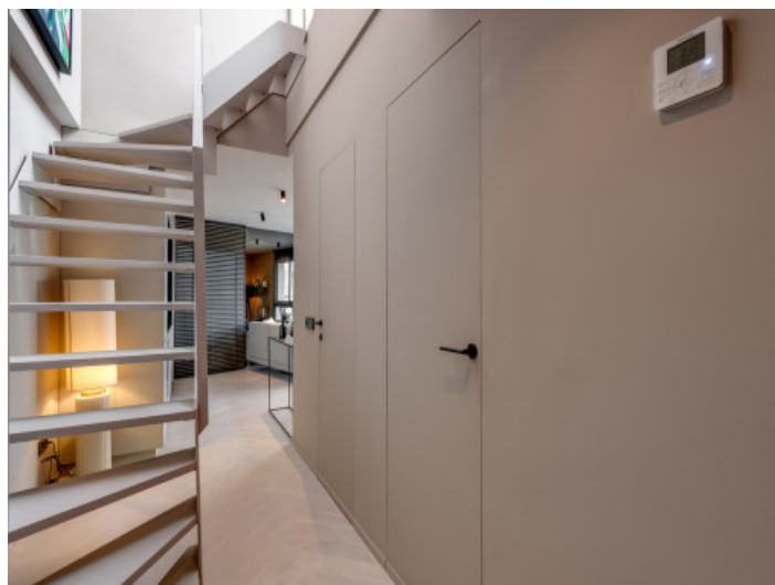
Pasillo con puertas integradas

Toda la información como mejor se puede saber, salvo por error durante el periodo de venta. Sirva este documento como un informe previo, las bases legales solo serán válidas a través de un contrato de compra acordado ante Notario.