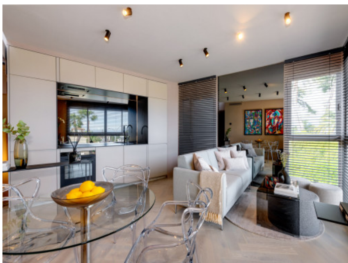
Diseño alternativo del salón