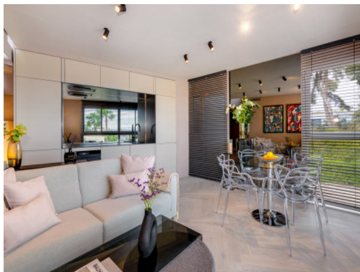
Salón-comedor de concepto abierto

Toda la información como mejor se puede saber, salvo por error durante el periodo de venta. Sirva este documento como un informe previo, las bases legales solo serán válidas a través de un contrato de compra acordado ante Notario.