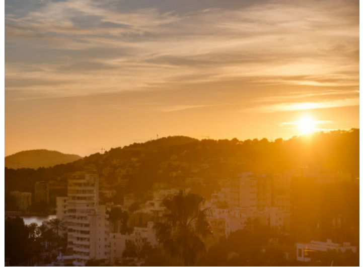
Terraza en la hora dorada