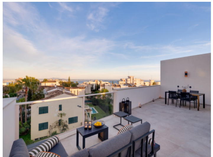
Ambiente nocturno sobre Palma

Toda la información como mejor se puede saber, salvo por error durante el periodo de venta. Sirva este documento como un informe previo, las bases legales solo serán validas a traves de un contrato de compra acordado ante Notario.