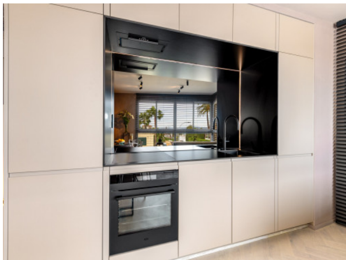
Cocina de diseño