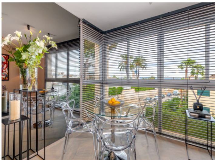
Comedor con vistas