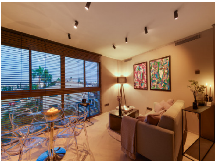
Ambiente nocturno en el salón