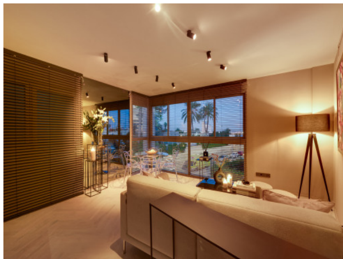
Concepto de iluminación dim-to-warm