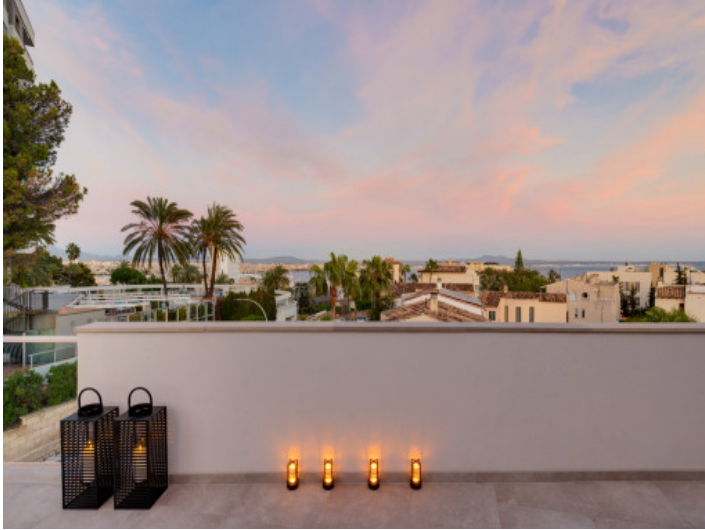
Terraza en la azotea por la tarde