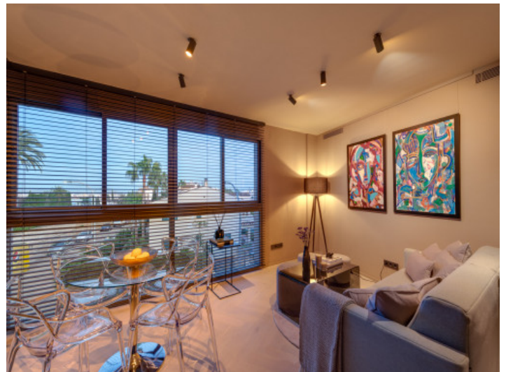
Concepto de iluminación acogedor