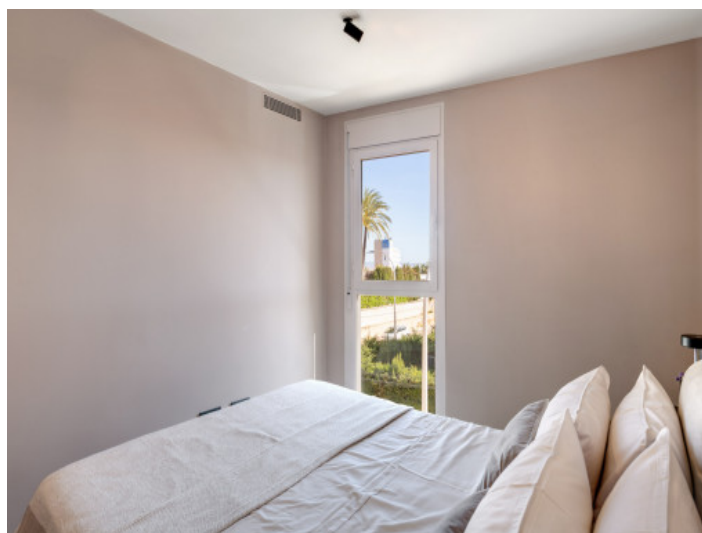
Dormitorio con vistas