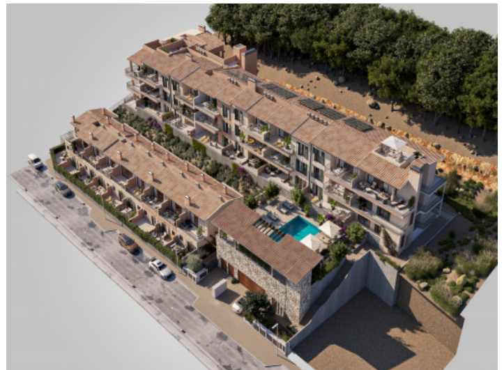
Vista on community

Toda la información como mejor se puede saber, salvo por error durante el periodo de venta. Sirva este documento como un informe previo, las bases legales solo serán válidas a traves de un contrato de compra acordado ante Notario.