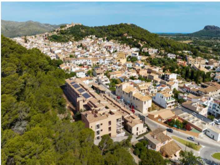
Ubicación of community