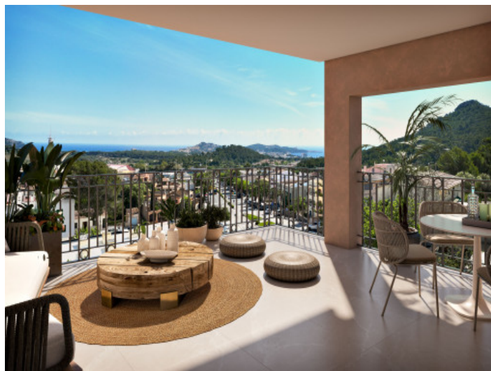
Terraza con vistas